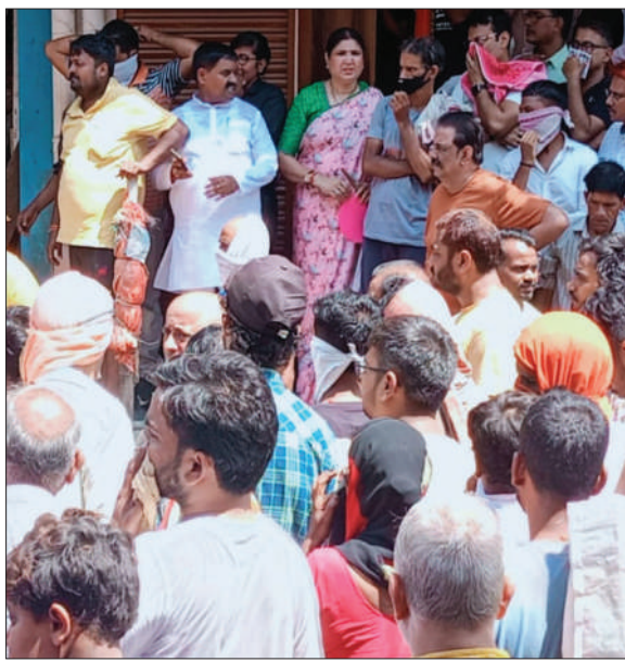
नहीं बुलाए होते तो हम सबों के पास हाथ पर हाथ रखे रहने के अलावे