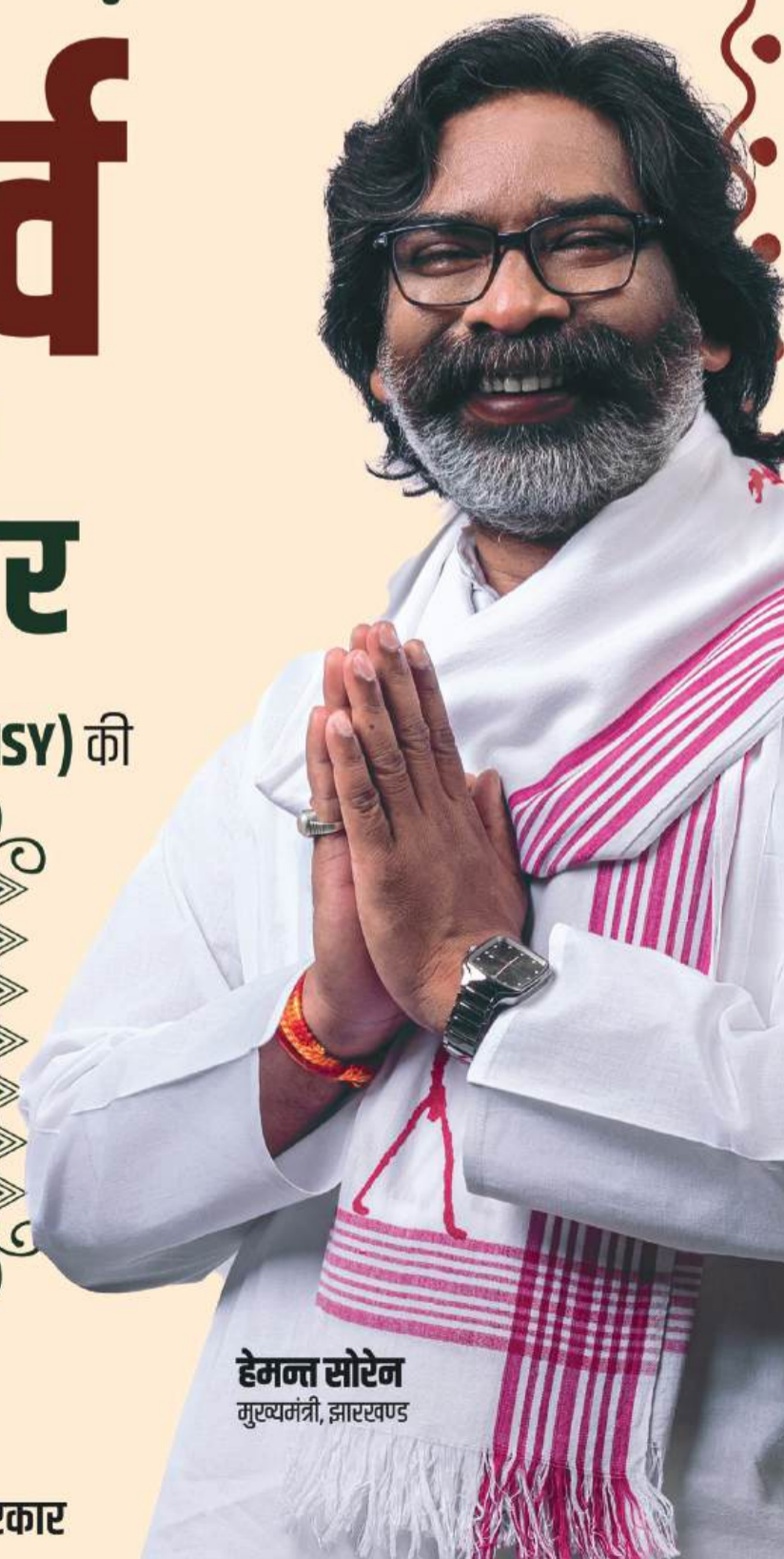
हेमन्त सोरेन मुख्यमंत्री, झारखण्ड

महिला, बाल विकास एवं सामाजिक सुरक्षा विभाग, झारखण्ड सरकार