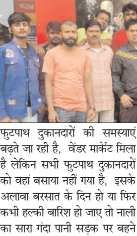
फुटपाथ दुकानदारों की समस्याएं बढ़ते जा रही हैं, वेंडर मार्केट मिला है लेकिन सभी फुटपाथ दुकानदारों को वहां बसाया नहीं गया है, इसके अलावा बरसात के दिन हो या फिर कभी हल्की बारिश हो जाए तो नाली का साया गंदा पानी सड़क पर बहने