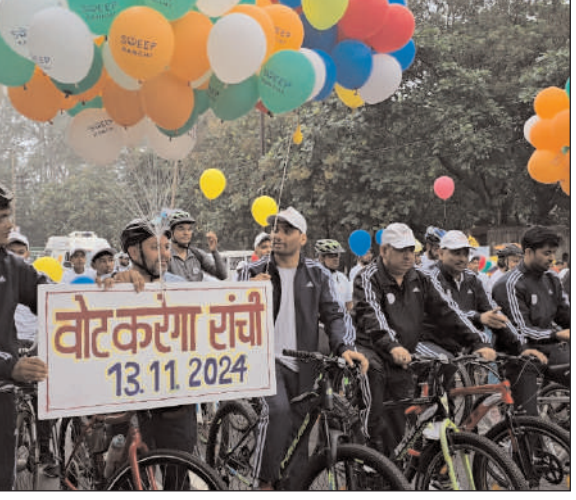
को मतदाताओं को जागरूक करने हेतु स्वीप के तहत कई कार्यक्रम करके मतदाताओं को जागरूक किया जा रहा है।