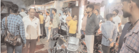
चार नंबर चौक पर संचालित सरकारी शराब दुकान के कारण आए दिन दुर्घटना हो रही है। लोग शराब लेने के लिए दुकान पहुंच रहे हैं और वाहन को सड़क पर ही छोड़ कर शराब लेने चले जाते हैं, जिसके कारण आवागमन करने वाले को काफी परेशानी होती है और दुर्घटना होती रहती है। इससे पूर्व भी कई बार यहां दुर्घटना हो चुकी है। स्थानीय लोगों ने शराब दुकान को यहां से हटाने की मांग भी की, लेकिन किसी प्रकार का ध्यान इस ओर नहीं दिया गया है, जिसके कारण दुर्घटना का सिलसिला लगातार जारी है। ग्रामीणों ने बताया कि बीच बाजार में शराब दुकान संचालित होने के कारण महिला, स्कूली बच्चों सहित पूजा पाठ के लिए आने-जाने वाले लोगों को काफी परेशानी हो रही है। ग्रामीणों ने बताया कि जब तक यहां से शराब दुकान को नहीं हटाया गया तब तक यहां दुर्घटना का सिलसिला जारी रहेगा। इधर पुलिस ने वाहन चालक को हिरासत में ले लिया है, जबकि दोनों वाहनों को जप्त कर लिया है। पुलिस के द्वारा आगे की कार्रवाई शुरू कर दी गई है।

प्रभात मंत्र संवाददाता पिपरवार : सीसीएल पिपरवार क्षेत्र के बचरा चार नम्बर चौक स्थित सरकारी शराब दुकान के समीप बीती रात एक तेज रफतार थार वाहन ने एक बाइक को अपनी चपेट में ले लिया। इस घटना में बाइक सवार युवक घायल हो गया। बताया जाता है कि टकराव इतनी जोरदार थी कि बाइक थार वाहन के नीचे पूरी तरह से घुस गया और बाइक पर सवार युवक दूर जाकर गिर गया। इस घटना के बाद काफी संख्या में वहां स्थानीय लोगों की भीड़ जमा हो गई। वहीं सूचना पाकर पिपरवार पुलिस मौके पर पहुंचकर मामले की जानकारी ली। स्थानीय ग्रामीण एवं पुलिस के सहयोग से घायल को बचरा क्षेत्रीय अस्पताल पहुंचाया गया, वहीं नशे में धुत वाहन चालक को पुलिस ने हिरासत में ले लिया। घटना के संबंध में मिली जानकारी के अनुसार सोमवारी को रात करीब 9 बजे घायल युवक आपने मोटरसाइकिल संख्या युपी 64ई-1540 से बचरा चार नंबर चौक से बचरा काली मंदिर स्थित अपने आवास जा रहा था, इसी बीच विपरीत दिशा से तेज रफतार से आ रही थार वाहन जिसका नम्बर जेएच 01एफयू- 6194 ने शराब दुकान के समीप बाईक को जोरदार टक्कर मार दी, घटना में बाईक सवार युवक सड़क पर गिर गया, जबकि बाईक थार वाहन के नीचे घुस गया। इसके बाद काफी मशकत करने के पश्चात स्थानीय पुलिस के द्वारा थार वाहन के नीचे से बाइक को निकाला गया। हादसे में बाइक पूरी तरह से क्षतिग्रस्त हो गया। इधर घटना के बाद स्थानीय ग्रामीणों ने अपना आक्रोश प्रकट किया। ग्रामीणों ने कहा कि बचरा