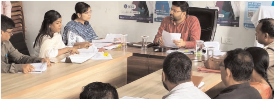
दिव्यांग व वरिष्ठ नागरिक के गृह वोट के दीए रूट चार्ट व मतदाता सूची के विषय पर विशेष चर्चा किया गया। साथ ही तोरपा व खूंटी विधानसभा क्षेत्र अंतर्गत करा प्रखंड में बनाये गये कुल पांच कलस्टर में

प्रभात मंत्र संवाददाता करा : प्रखंड सभागार में शनिवार को आगामी विधानसभा चुनाव 2024 को लेकर जिला उपायुक्त लोकेश मिश्रा की अध्यक्षता पर समीक्षा बैठक का आयोजन किया गया। बैठक में मुख्य रूप से विधानसभा तोरपा -59 के 31 बूथ एवं विधानसभा खूंटी -60 के 79 बूथ के सेक्टर वाइज मतदान केन्द्रों कि मूलभूत सुविधा, रूट चार्ट, महिला बूथ, डायरेक्ट बूथ, कॉमनिकेशन प्लान, मोलेटियर लिस्ट, कलस्टर पॉइंट, कलस्टर इंचार्ज, स्टोर रूम इंचार्ज, सेक्टर मजिस्ट्रेट में प्रतिनियुक्त पुलिस बल, दिव्यांग व वरिष्ठ नागरिक के गृह वोट के दीए रूट चार्ट व मतदाता सूची के विषय पर विशेष चर्चा किया गया। साथ ही तोरपा व खूंटी विधानसभा क्षेत्र अंतर्गत करा प्रखंड में बनाये गये कुल पांच कलस्टर में