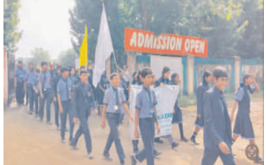
आदि सहित विभिन्न प्रतियोगिताओं का आयोजन किया गया। आज दिनांक 29 10 2024, दिन मंगलवार को बाघवार एकेडमी के कक्षा 6 से 12वीं तक के लगभग डेढ़ सौ बच्चों ने प्रभात फेरी के

प्रभात मंत्र संवाददाता चान्हो : मंगलवार को बाघवार एकेडमी के कक्षा 6 से 12 तक के छात्र एवं छात्राओं के द्वारा प्रभात फेरी के माध्यम से मतदाता जागरूकता अभियान चलाया गया। आप सबों को ज्ञात हो कि झारखंड सरकार के आदेशानुसार प्रत्येक सरकारी एवं गैर सरकारी विद्यालयों में दिनांक 28 एवं 29 अक्टूबर को स्वीप एक्टिविटी के तहत विभिन्न प्रतियोगिताओं का आयोजन किया जाना था। जिसके तहत विद्यालय प्रारंभ में दिनांक 28 10.2024 दिन सोमवार को उपरोक्त विषय पर चित्रकला, पोस्टर बनाना, रंगोली, वाद विवाद प्रतियोगिता, क्रिज