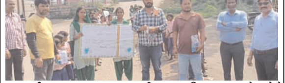
खलारी (प्रभात मंत्र संवाददाता): राजकीयकृत मध्य विद्यालय बुकबुका के छात्रों ने मंगलवार को मतदाता जागरूकता अभियान को लेकर प्रभात फेरी निकाली। प्रभात फेरी विद्यालय के पोषक नेत्रा धौडा, प्रमति नगर, प्रकाश कॉलेज, चानक धौडा, जानकी मंदिर कॉलेज, केडी मुख्य बाजार होते हुए नेहरू स्टेडियम, अडेडर चैक सहित अन्य जगहों से होते हुए पुनः विद्यालय पर आकर समाप्त हुई। इस दौरान बच्चों ने मतदाता जागरूकता संबंधी स्लोगन लिखा तखती हथों में लिए हुए थे। वहीं रास्ते में 'मतदान करना जरूरी है' जैसे नारे लगाए और मतदाताओं को वोट देने के लिए प्रेरित किया गया।