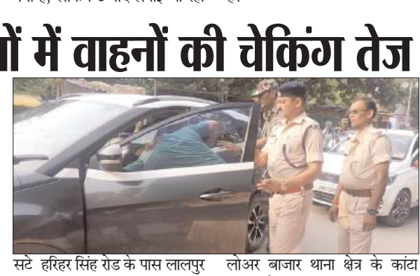
सीमावर्ती क्षेत्रों में वाहनों की चेकिंग तेज

रांची। झारखंड विधानसभा चुनाव के मद्देनजर रांची में भी चुनाव आयोग का निदेश का कड़ाई से पालन किया जा रहा है। निर्वाचन आयोग द्वारा यह सख्त निदेश दिया गया था, कि सभी सीमावर्ती क्षेत्रों में चेक पोस्ट लगाया जाए और वाहनों की चेकिंग करें। कोई भी व्यक्ति 50,000 नगद राशि से अधिक ले जा रहा हो तो उन पैसों को जब्त किया जाए, उनसे पूछताछ जाए और वाहनों की चेकिंग का काम के लिए जैसे लेक्टर जा रहे हैं। इसी के मद्दे नजर रांची विधानसभा के मोरहाबादी मैदान से