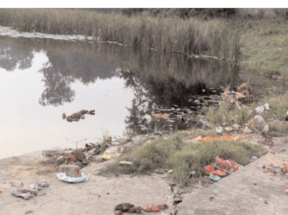
मिलाकर कुल चार दिनों तक छठ ब्रतियों को छठ घाटों पर आना-जाना लगा रहता है। बावजूद अबतक छठ घाटों की सफाई को लेकर कोई रद्धान नहीं दिखाई दे रही है। हालांकि दीपावली समाप्त के बाद छठ घाटों की सफाई के लिए छठ पूजा समिति के साथ स्थानीय समाजसेवी, सामाजिक संगठन, प्रतिनिधि एवं जनप्रतिनिधि सफाई कार्यक्रम में जुट जाते हैं। वहीं एक-एक परियोजना के सीसीएल प्रबंधन भी प्रत्येक वर्ष छठ घाटों से लेकर छठ घाट मार्ग की साफ-सफाई के लिए मशीन उपलब्ध कराते हैं।

प्रभात मंत्र संवाददाता खलारी : खलारी कोयलांचल में करीब एक दर्जन घाट हैं, जहां छठवती अर्धय देती है और छठ महापर्व का महज 12 दिन शेष है। परंतु आलम यह है कि वर्तमान में एक भी छठ घाट ऐसा नहीं है, जहां नियमित साफ सफाई होता हो। इसके कारण क्षेत्र के सभी छठ घाटों पर गंदगी फैल जाती है। इसके अलावा क्षेत्र के आज भी कई ऐसे छठ घाट हैं, जहां छठ घाट पहुंच पथ मार्ग जर्जर अवस्था में है। दीपावली उत्सव के ठीक चौथे दिन से चार दिवसीय छठ महापर्व शुरू हो जाता है। इस क्रम में नहाय-खाय से लेकर खरना एवं पहली व दूसरी अर्धय