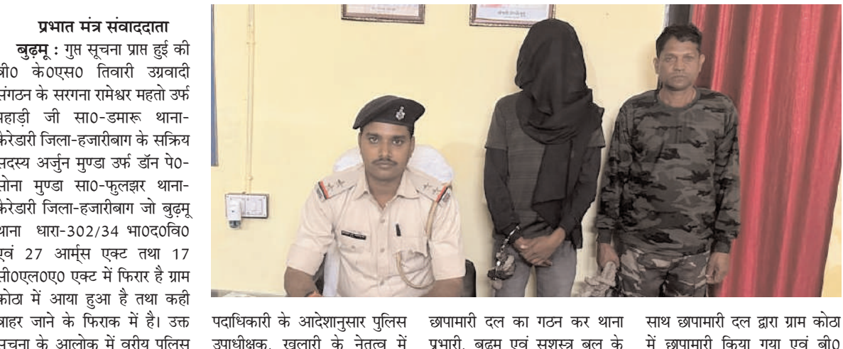
पदाधिकारी के आदेशानुसार पुलिस उपाधीक्षक, खलारी के नेतृत्व में छापामारी दल का गठन कर थाना प्रभारी, बुढू एवं सशस्त्र बल के साथ छापामारी दल द्वारा ग्राम कोठ साथ छापामारी किया गया एवं बी0