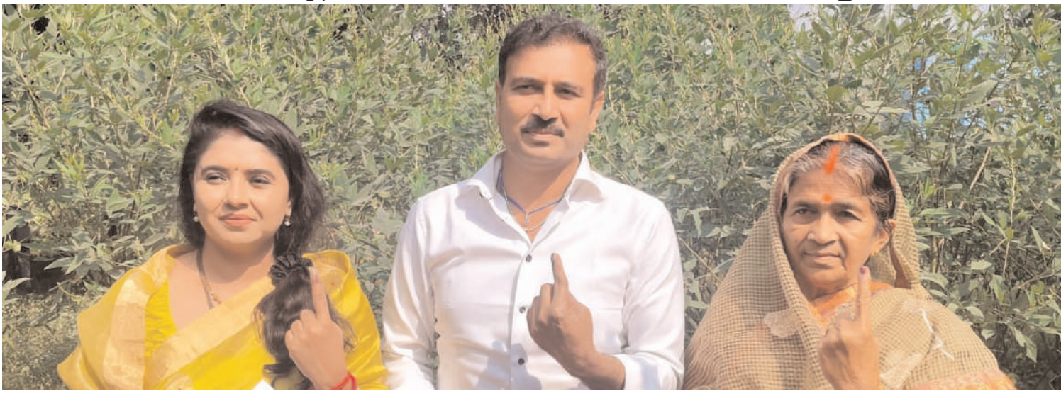
चुनाव के दौरान कहीं से भी कोई अप्रिय घटना की सूचना नहीं है। इलाके में मतदान को लेकर

प्रभात मंत्र संवाददाता सिल्ली : सिल्ली-मुरी एवं आसपास के क्षेत्र में शांतिपूर्ण मतदान संपन्न हो गया। सिल्ली प्रखंड में 74.59 प्रतिशत मतदान हुआ जो पिछले विधानसभा चुनाव से 3.40 प्रतिशत अधिक रहा। वहीं सिल्ली विधानसभा में कुल 76.7 प्रतिशत मतदान हुआ। बुधवार को मतदान के दौरान पुरुष के साथ-साथ महिलाओं ने भी बह चढ़ कर हिस्सा लिया। वहीं मतदान को शांतिपूर्ण ढंग से पूरा करने में 900 से अधिक सुरक्षा बल तैनात किये गये थे। वहीं कई बुधों में चिकित्सा दल बंबुलेंस को भी रखा गया था। सिल्ली के 111 बुधों पर वेबकास्टिंग के जरिये सीधे मोनोटोरिंग की जा रही थी। वहीं लगाम मतदान केंद्र को फूलों से सजाया गया था।