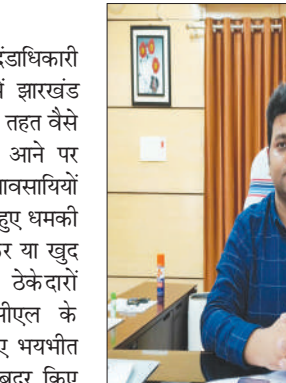
जिला दंडाधिकारी के न्यायालय द्वारा की गई सुनवाई में निम्न आदेश जारी किए गए हैं।