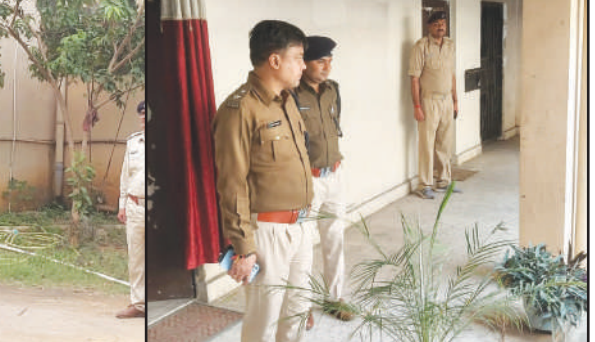
आवश्यक निर्देश पु0नि0-सह-अन्य पुलिस पदाधिकारी / कर्मियों को दिया गया।