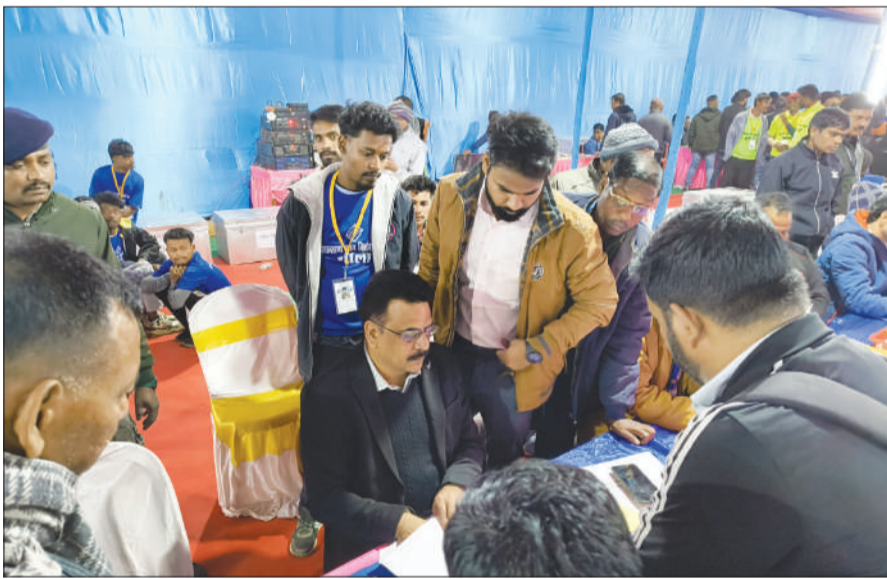
अन्य उपस्थित थे। साथ ही रामगढ़ महाविद्यालय रामगढ़ में पोलिंग पार्टियों के लिए विभिन्न सुविधाएं