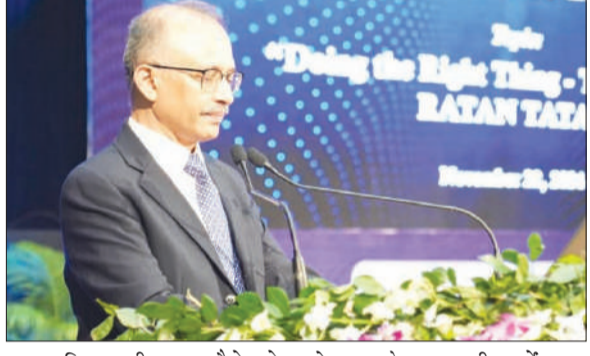
वापस किए इसी प्रकार नौनो को लेकर रतन टाटा ने घोषणा किया था कि वे उपभोक्ताओं को एक लाख रुपये में नौनो कार देंगे...