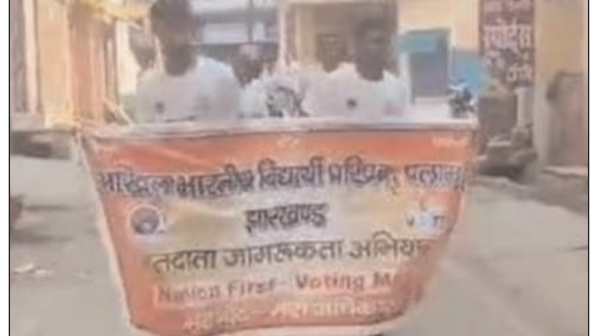
उपस्थित स्वर्णकार संघ के सदस्यों ने कहा कि इसमें 18 वर्ष से अधिक उम्र के युवा बड़-चढ़ कर हिस्सा लें और मतदान अवश्य करें, इससे स्वस्थ एवं मजबूत राष्ट्र का निर्माण हो सके। उन्होंने कालेज के विद्यार्थियों को भी निर्भीक एवं निष्पक्ष होकर स्वतंत्रतापूर्वक बिना प्रलोभन के चुनाव में अपने मत का

प्रभात मंत्र संवाददाता मेदिनीनगर : अखिल भारतीय विद्यार्थी परिषद और स्वर्णकार समिति पलामू ने रविवार को मेदिनीनगर में मतदान जागरूकता को लेकर रन फॉर भारत का आयोजन किया। जिसमें बड़ी संख्या में विद्यार्थी परिषद और स्वर्णकार संघ के लोगो ने भाग लिया। दोनों कार्यकर्ता रविवार की सुबह पुलिस लाइन से दौड़ते हुए कोयल नदी रिवरव्यू पहुंचे। और इस कार्यक्रम का समापन हुआ। मौके पर उपस्थित विद्यार्थी परिषद के सदस्यों ने कहा कि इसमें 18 वर्ष से अधिक उम्र के युवा बड़-चढ़ कर हिस्सा लें और मतदान अवश्य करें, इससे स्वस्थ एवं मजबूत राष्ट्र का निर्माण हो सके। उन्होंने कालेज के विद्यार्थियों को भी निर्भीक एवं निष्पक्ष होकर स्वतंत्रतापूर्वक बिना प्रलोभन के चुनाव में अपने मत का