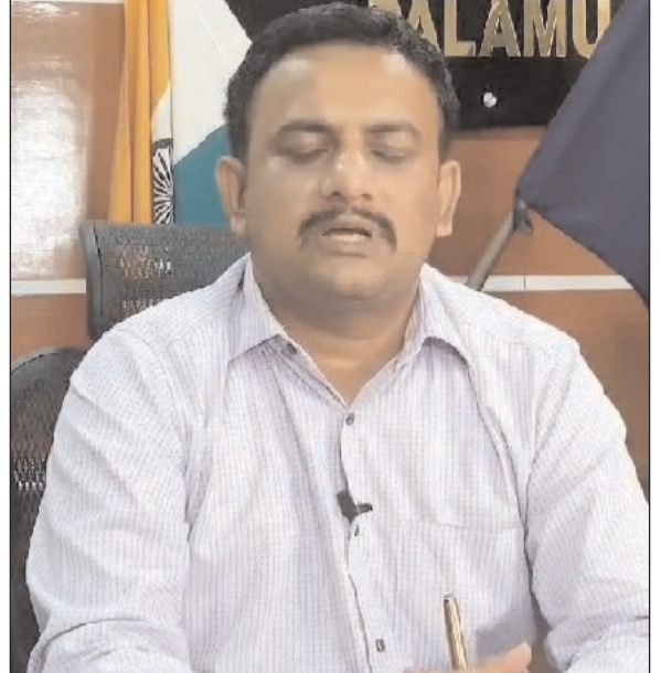
समावेशी-समतामूलक समाज की देश हित में 13 मई 2024 को परिकल्पना को साकार करने में अपने बूथ पर जाकर मतदान

प्रभात मंत्र संवाददाता मेदिनीनगर : जिला निर्वाचन पदाधिकारी सह उपायुक्त शशि रंजन ने जिलेवासियों से अपील करते हुए कहा कि लोकसभा आम चुनाव के महालयार के मौके पर आगामी 13 मई 2024 को आपकी वृहद सहभागिता अत्यावश्यक है, अन्यथा लोकतंत्र जिन सिद्धान्तों के आधार पर परिपक्व होता है, उसकी पूर्ति होना सम्भव नहीं है। उन्होंने कहा कि हमें उम्मीद है कि आप स्वतंत्र, निष्पक्ष एवं शांतिपूर्ण निर्वाचन की गरिमा को बनाये रखते हुए निर्भय होकर धर्म, वर्ग, जाति, समुदाय, भाषा अथवा अन्य किसी भी प्रलोभन से प्रभावित हुए बिना अपने मत का प्रयोग करेंगे। उन्होंने कहा कि आप सभी से अनुरोध है कि आप अपने मतदान केंद्र पर मतदान के दिन अवश्य जायें और लोकतंत्र की सफलता, गतिशीलता एवं