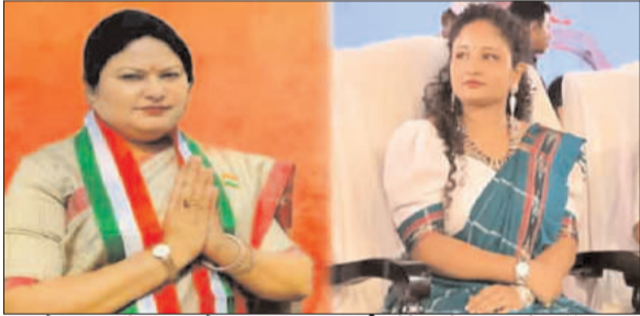
झामुमो पार्टी में भी कोई पद या स्थान नहीं है। बावजूद इसके उनको मुख्यमंत्री से बड़ा प्रोजेक्ट दिया जा रहा है और वहीं सुपर सीएम के तौर पर फैसले ले रही हैं।

रांची : दुमका लोकसभा सीट से भाजपा प्रत्याशी सीता सोरेन ने फिर पूर्व मुख्यमंत्री हेमंत सोरेन की पत्नी कल्पना सोरेन को निशाने पर लिया है। उन्होंने रविवार को सोशल मीडिया एक्स पर मुख्यमंत्री के लिए भी चिंता जाहिर की है। साथ ही झामुमो में उपेक्षा किए जाने का आरोप भी दोहराया। सीता सोरेन ने कहा कि चम्पाई सोरेन को नाममात्र का मुख्यमंत्री बनाकर रखा गया है। उनकी बजाय कल्पना सोरेन को अधिक महत्व है। कल्पना का