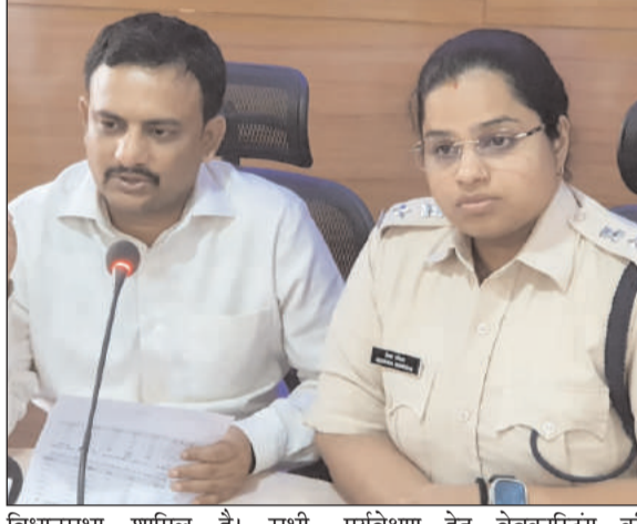
विधानसभा शामिल है। सभी विधानसभा में सुबह 7 से शाम 5 बजे तक मतदान होगा। आज गणेश लाल अग्रवाल कॉलेज से 213 बूथों के लिए मतदान पार्टी को डिस्ट्रिक्ट किया गया वहीं रविवार को 2214 बूथों के लिये पोलिंग पार्टी को डिस्ट्रिक्ट कराया जायेगा। इस बार सभी 2427 मतदान केंद्रों पर निर्वाचन कार्यों के

प्रभात मंत्र संवाददाता मेदिनीनगर : पलामू लोकसभा सीट के लिए आज 13 मई को होने वाले मतदान को लेकर शनिवार को चुनाव प्रचार थम गया। हालांकि इस दौरान डोर टू डोर अभियान पर रोक नहीं है। वहीं आज शाम 5 बजे से लेकर मतदान समाप्ति तक डूँड डे रहेगा। बाहर से चुनाव प्रचार करने आये लोगो को शहर में रहने की अनुमति नहीं होगी। लाउडस्पीकर का प्रयोग वर्जित रहेगा। इधर, निष्पक्ष व शांतिपूर्ण मतदान करने को लेकर प्रशासन द्वारा आवश्यक तैयारी पूरी कर ली गई है। गणेश लाल अग्रवाल कॉलेज में डीसी-एसपी ने मतदान कर्मियों को आवश्यक निर्देश दिए। पलामू लोकसभा क्षेत्र अंतर्गत कुल 2427 बूथ बनाये गये हैं जहाँ 2243034 मतदाता मतदान करेंगे। मताधिकार का प्रयोग करेंगे। जिला निर्वाचन पदाधिकारी व पुलिस अधीक्षक ने प्रेस वार्ता कर तैयारी की जानकारी दी। उन्होंने बताया कि पलामू लोकसभा अंतर्गत कुल छः