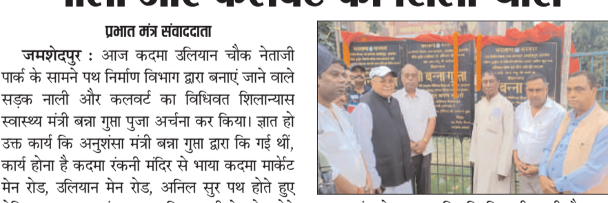
प्रगत मंत्र संवाददाता