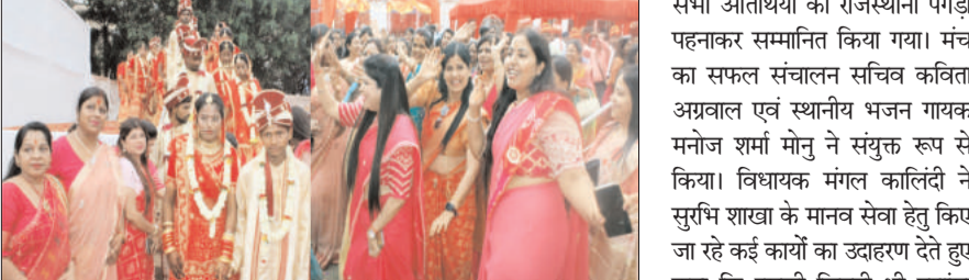
प्रगत मंत्र संवाददाता

प्रगत मंत्र संवाददाता जमशेदपुर : रविवार को साकची स्थित धालभूम क्लब परिसर में मावाड़ी युवा मंच स्टील सिटी सुरभि शाखा द्वारा आर्थिक रूप से कमजोर 11 बेटियों का सामूहिक विवाह कराया गया। गाजे बाजे के साथ 11 दुल्हों की बारात एक साथ आयी। बारात आने से पहले मावाड़ी समाज के युवाओं की टीम ने माया भरने का शानदार आयोजन किया। माया कार्यक्रम के दौरान राजस्थानी भजनों पर नृत्य भी किया गया। इस दौरान मुख्य कार्यक्रम में मंच पर सुरक्षा एवं विधि व्यवस्था के संधारण में किसी भी प्रकार से कोई चूक नहीं हो इसे सुनिश्चित करने का निर्देश दिया। मौके पर एडीएम लॉ एंड ऑर्डर, झारखंड स्टेट मिल्क कॉर्पोरेशन फेडरेशन के जोषम, डीटीओ, डीपीआर के (जनसमर्क), नगर निगराय के पदाधिकारी, भवन निर्माण के पदाधिकारी समेत अन्य संबंधित पदाधिकारी मौजूद रहे।