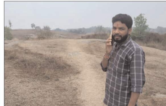
वह भाड़ का गाड़ी चलाता है वह क्रशर मालिक का गाड़ी नहीं चलाता