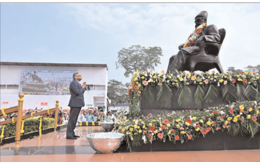
प्रगत मंत्र संवाददाता