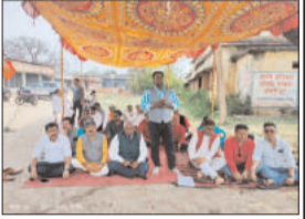
रामगढ़ ब्लॉक परिसर में भाजपा के द्वारा धरना प्रदर्शन किया गया