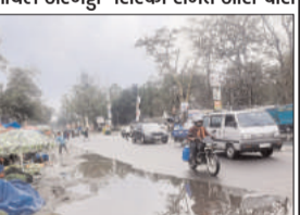
कोयलांचल अरगड्डा- सिरका से अधिक रामगढ़ में वर्षा पानी, सड़कों बगल भरा जल

रामगढ़ (प्रभात मंत्र संवाददाता): कोयलांचल अरगड्डा- सिरका समेत आस-पास के क्षेत्र में दोपहर 2 बजे के बाद काले बादलों ने बरसना आरंभ किया। जबकि शहर रामगढ़ में 20 मिनिट से अधिक जोरदार वर्षा हुई। जिससे मुख्य सड़कों पर पानी भर आया। सड़कें लगाए दुकानदारों के सड़कियों में पानी भर आया। अस्त-व्यस्त की स्थिति उत्पन्न हो गई। बतलाते कि बीते रात्रि भी अरगड्डा क्षेत्र एवं अगल बगल के इलाके में वर्षा हुई थी। इसे लेकर कहीं से भी अप्रिय घटना की खबर नहीं प्राप्त हुई है।