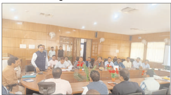
आगामी लोकसभा आम निर्वाचन 2024 के मद्देनजर उड़न दस्ता दलों एवं स्थैतिक निगरानी दलों के लिए हुआ प्रशिक्षण का आयोजन