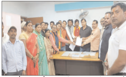
झारखंड सरकार की अकर्मण्यता के खिलाफ भाजपा का धरना प्रदर्शन