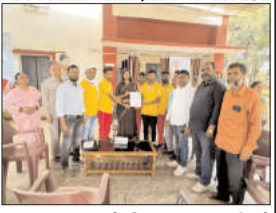
विधायक अंबा का लगा जनात दरबार