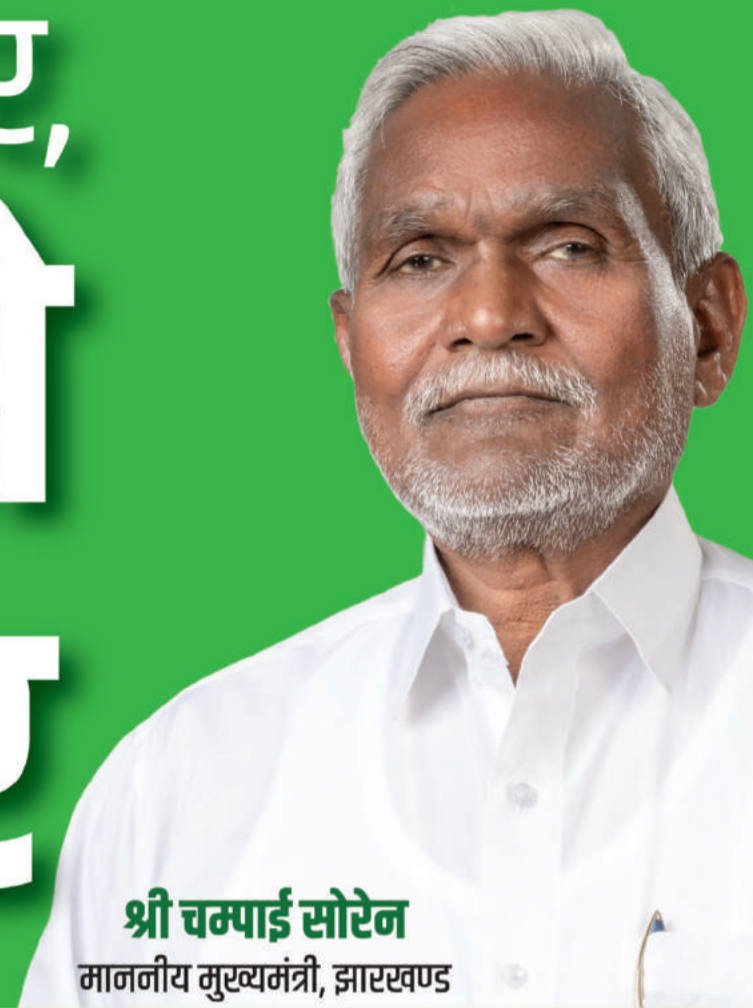
श्री चम्पाई सोरेन माननीय मुख्यमंत्री, झारखण्ड