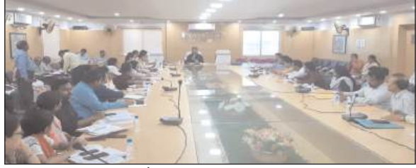
पर रोष व्यक्त किया गया और योजना की पूर्णता में तेजी लाये जाने का निर्देश दिया गया। बिरसा हरित ग्राम योजना में बागवानी योजना में मिट्टी की जांच के बाद ही चयन किये जाने का निर्देश दिया गया। इसके बारे में लाभुकों को बेहतर तरीके से अवगत कराने का निर्देश दिया गया। पंचायती राज विभाग अंतर्गत सभी पंचायत सचिवालय में इंटरनेट, प्रज्ञा केंद्र की सुविधा मुहैया कराने का निर्देश दिया गया। कल्याण विभाग अंतर्गत आवासीय विशालय जीर्णोद्धार का कार्य पूर्ण करने का निर्देश दिया गया। इसी प्रकार समाज कल्याण विभाग को पूर्ण हो चुके आंगनवाड़ी केंद्रों का हैण्डओवर लिये जाने का निर्देश दिया गया। कृषि विभाग को मुख्यमंत्री कृषि ऋण माफी योजना अंतर्गत ई-केवाईसी का कार्य पूर्ण करने का निर्देश दिया गया। स्वास्थ्य विभाग को आयुष्मान कार्ड योजना अंतर्गत प्रगति लाने का निर्देश दिया गया। इसी प्रकार अनुआ आवास योजना, मुख्यमंत्री रोजगार योजना, सावित्रीबाई फुले योजना, मुख्यमंत्री पशुधन योजना, दारिद्र्य खासिज, जल जीवन मिशन, वनाधिकार पट्टा, एससी-एसटी एक्ट, खनन विभाग, विधि-व्यवस्था, ने तंबाकू नियंत्रण अभियान आदि की समीक्षा की गई और निर्देश दिये गये। आज की बैठक में वन प्रमण्डल पदाधिकारी अरविंद कुमार, अपर समाहर्ता जीतेन्द्र मुण्डा, एसडीओ अमित कुमार, एसडीपीओ श्रद्धा केरकेडू समेत सभी जिला स्तरीय पदाधिकारी, सभी प्रखण्ड स्तरीय पदाधिकारी समेत अन्य उपस्थित थे।

लोहरदगा : मुख्यमंत्री चंपाई सोमन द्वारा विभिन्न विभागों को दिये गये निर्देशों की ब्रीफिंग आज शनिवार को उप विकास आयुक्त दिलीप प्रताप सिंह शेखावत द्वारा जिला परिषद कार्यालय स्थित सभाकक्ष में पदाधिकारियों के बीच की गई। बैठक में ग्रामीण विकास अंतर्गत वीर शहीद पोटे हो खेल विकास योजना अंतर्गत एक सप्ताह में भूमि चिन्हित करने का निर्देश सभी अंचलाधिकारियों को दिया गया। बिरसा सिंचाई कूप अंतर्गत जिन लाभुकों का भुगतान लंबित है उनका भुगतान किये जाने का निर्देश दिया गया। मनरेगा अंतर्गत प्रत्येक गांव औसतन पांच योजनाएं संचालित किये जाने का निर्देश दिया गया। मनरेगा योजनाओं का भौतिक निरीक्षण अवश्य करें। योजना की समीक्षा अवश्य करें। जेएसएलपीएस को फर्स्ट क्रेडिट लिंकेज के बाद दूसरी व तीसरी लिंकेज भी समय से किये जाने व एसएचजी की मॉनिटरिंग किये जाने का निर्देश दिया गया। प्रधानमंत्री आवास योजना में किस्को और सेन्हा प्रखण्ड में आवास की पूर्णता में कमी