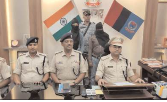
रजरप्पा थाना काण्ड संख्या-109/2024, धारा-457/380 भादवि के अंतर्गत अज्ञात चोरों के विरुद्ध प्राथमिकी दर्ज किया गया। उसी रात्रि राजकीय बुनियादी विद्यालय