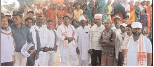
कार्ड गरीबों के लिए सभी राशन कार्ड से वंचित को हरा राशन कार्ड से जोड़ा गया हरा राशन कार्ड बनने से लोगों को स्वास्थ्य की सुविधा मिलेगी। राशन कार्ड के माध्यम से 10 रूपया में धोती, लूंगी, साड़ी का वितरण किया जा रहा है। पिता कार्ड के माध्यम से चीनी देने का भी काम किया जा रहा है। ये सभी कार्य भरे विभाग और गठबंधन सरकार के द्वारा कार्य किया जा रहा है। जिससे गरीब लोगो को लाभ दिया जा रहा है। पेयजल हेतु सभी पंचायत में 10-10 चापाकल का निर्माण किया जा रहा है जिससे पेयजल की समस्या से निजात मिलेगी। इसके साथ ही

प्रभात मंत्र संवाददाता लोहरदगा : शनिवार को माननीय विधायक लोहरदगा सह मंत्री डॉ रामेश्वर उरांव के द्वारा पेशार प्रखंड के सुदूरवर्ती गांवों का दौरा कर जनता के जनसमस्याओं से हल्वे रूबरू। क्षेत्र भ्रमण कार्यक्रम पेशार प्रखंड के सीरम पंचायत अंतर्गत ग्राम भक्का बाजार टांड एवं संभुवा में किया गया। कार्यक्रम में ग्रामीणों के द्वारा डॉ रामेश्वर उरांव के आगमन में उनका स्वागत किया गया। इस मौके ग्रामीणों के द्वारा माननीय विधायक सह मंत्री डॉ रामेश्वर उरांव के समक्ष ग्रामीणों के द्वारा जनसमस्याओं से अवगत कराया गया। इस मौके पर डॉ रामेश्वर उरांव ने कहा सरकार की योजना गांव-गांव तक किया जा रहा विकास का कार्य जनता का हो रहा है। लाभ। झारखंड सरकार के द्वारा अनेकों विकास का कार्य कर रही है जिससे ग्रामीणों तक लाभ पहुंच रही है। सबसे पहले हरा राशन