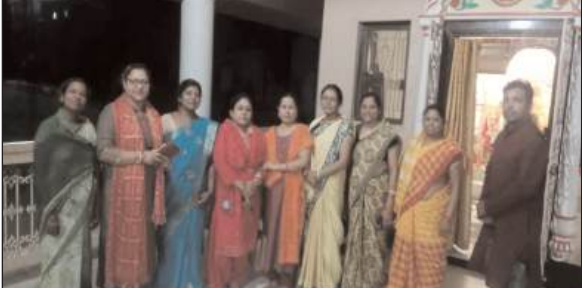
पूजा और पवित्र नदी में स्नान करने का विधान है वही मान्यता है की गंगा दशहरा पर अन्न, भोजन और जल समेत आदि चीजों का दान करता है तो उसे अक्षय पुण्य की प्राप्ति होती है वही आपको बता दें कि इस साल गंगा दशहरा आज रविवार को मनाया जाएगा। इस दिन सुबह जल्दी उठ जाएं वहीं अगर रात स्नान नहीं कर पाए तो घर पर ही गंगाजल बाट्टी में डालकर स्नान कर लें वहीं इसके बाद अब तांबे के लोटे में जल लेकर उसमें गंगाजल अक्षत और फूल डालकर सूर्य देव को अर्घ्य दिन साथ ही गंगा आरती

प्रभात मंत्र संवाददाता लोहरदगा : जिले में बजरंग दल के द्वारा गंगा दशहरा के उपलक्ष्य में श्री राम मंदिर फुलवारी परिसर में बैठक की गई बैठक में गंगा दशहरा को लेकर चर्चा की गई। गंगा दशहरा आज संध्या 7:00 बजे शिव मंदिर बड़ा तालाब में किया जाएगा। सभी माताएं बहनें राम भक्त से आग्रह होगा कि आज गंगा दशहरा में सम्मिलित होकर पुण्य के भागी बनें। साथ ही साथ सभी धार्मिक संगठन एवं सामाजिक संगठन के राम भक्तों से आग्रह होगा कि स समय गंगा दशहरा में पहुंचकर कार्यक्रम का उससाह बढ़ाएं। गंगा दशहरा की कुछ विशेषताएं का वर्णन किया गया है जिसमें हिंदू धर्म में गंगा दशहरा का विशेष महत्व है। पंचांग के अनुसार हर साल ज्येष्ठ शुक्ल पक्ष की दशमी को दशहरा मनाया जाता है मान्यता है कि इस दिन पृथ्वी पर मां गंगा का अवतरण हुआ था। इसलिए इस शुभ अवसर पर मां गंगा की