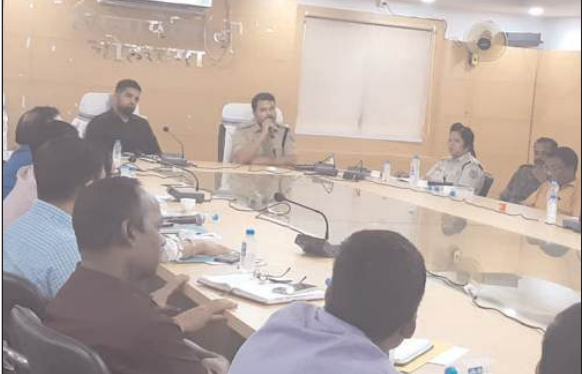
सार्वजनिक स्थल पर नहीं होना चाहिए। इसे लोग अपने घर के परिसर में ही करें। साथ ही जो भी अपशिष्ट बचता है उसका निपटान