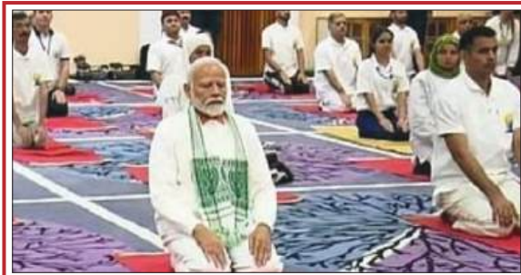
श्रीनगर : 10वें अंतरराष्ट्रीय योग दिवस के मुख्य समारोह को पीएम ने किया संबोधित