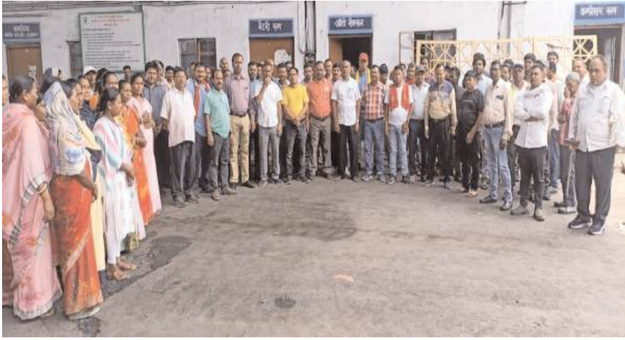
कि सीसीएल प्रबंधन लगातार मजदूरों के सुख सुविधा पर हमला कर रहे है।

प्रभात मंत्र संवाददाता पिपरवार : सीसीएल पिपरवार एरिया में कोयला मजदूरों ने अब खुलकर बायोमेट्रिक सिस्टम का विरोध करना शुरू कर दिया है। मजदूर बायोमेट्रिक सिस्टम के खिलाफ लगातार विरोध प्रदर्शन कर प्रबंधन के प्रति नाराजगी जता रहे हैं। शुरुआत को अशोक परियोजना के वर्कशॉप कार्यालय में कार्य के दौरान मजदूरों ने जमकर विरोध प्रदर्शन किया और बायोमेट्रिक सिस्टम का पुनः प्रयोग से विरोध किया। मजदूरों ने प्रबंधन से पिपरवार में बायोमेट्रिक सिस्टम को बंद कर पूर्व की तरह मजदूरों की हाजिरी बनाने की मांग की है। इस संबंध में कोयला मजदूरों ने बताया