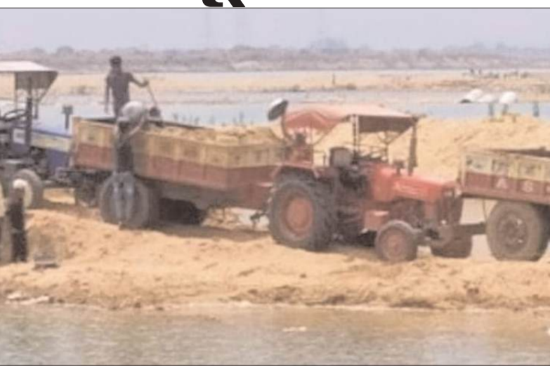
प्रभात मंत्र संवाददाता धनबाद : उपायुक्त सह जिला दंडाधिकारी