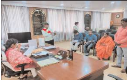
जाएगा। जनता दरबार में मुख्यतः जमीन विवाद संबंधी, पारिवारिक विवाद, ऑनलाइन रसिद, मु. आ व जा, सड़क, आवास निर्माण, जमीन बंदोबस्ती, रोजगार, रोजगार सेवक के खिलाफ शिकायत, आम लाइसेंस, अवैध कब्जा समेत अन्य समस्याओं से अवगत हुए। उपायुक्त ने लोगों को पूर्ण भरोसा दिलाया कि आपकी समस्याओं को दूर करना जिला प्रशासन की प्राथमिकता है। जिला प्रशासन विधि सम्मत आपकी हर समस्याओं को दूर करने का प्रयास करेगा।