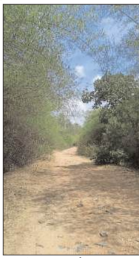
कहा कि अखबार में खबर पढ़कर मैं काफी प्रभावित हुआ हूं और पूरी कोशिश करूंगा कि उक्त गांव तक जो फिलहाल पथरीला रास्ता है उसे कम से कम चलने के लायक बनावा सकूँ। विधायक के पीएस ने