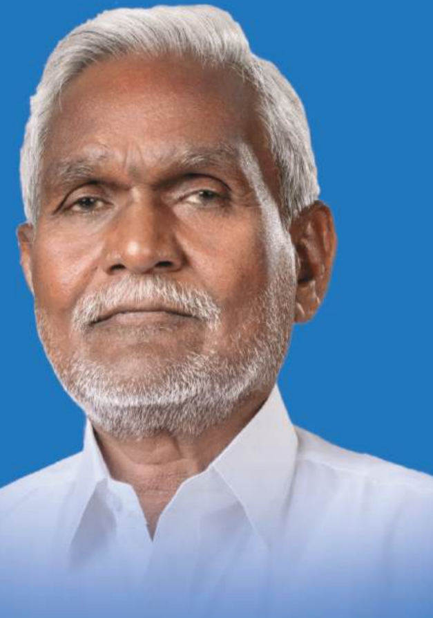
श्री चम्पाई सोरेन मुख्यमंत्री, झारखण्ड

इलेक्ट्रॉनिक संसाधनों के व्यापक इस्तेमाल पर जोर दिया गया है, इसमें ऑडियो-वीडियो संसाधनों के साथ-साथ इलेक्ट्रॉनिक सूचना माध्यम का भी इस्तेमाल किया जा सकेगा।