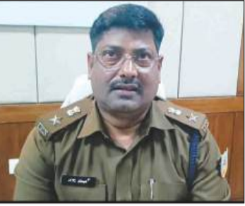
कई सड़कों से हटाया गया अतिक्रमण

व्यवस्था को लेकर काफी दिक्कतों का सामना कर रहे हैं. बाजार, कोर्ट कचहरी अस्पताल, स्कूल जाने के क्रम में कितनी जुबिसों का सामना करते अपने मॉडल तक पहुंचते हैं जिसका अंदाजा लगाना सहज नहीं है. ट्रैफिक समस्या विकराल रूप धारण कर लिया तो तंग आकर हजारीबाग के एक सज्जन ने हाईकोर्ट में जनहित याचिका दायर कर दी. जिसके बाद यहाँ के पुलिस कप्तान को इसको लेकर हाई कोर्ट में सशरीर उपस्थित होना पड़ा. हाई कोर्ट में पुलिस अधीक्षक ने ट्रैफिक व्यवस्था में जल्द सुधार करने का वादा किया है जिसके बाद पुलिस प्रशासन पूरे एक्शन मोड पर दिखाई दे रही है.