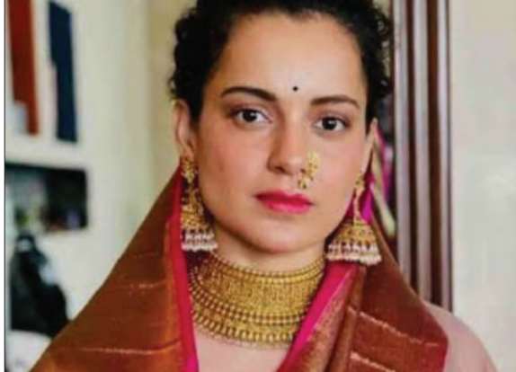
हो जाएगी तो वहीं मणिकर्ण में भी भूमि मिल जाएगी। कूड़ शहर में कूड़ा संयंत्र केंद्र के लिए वन भूमि से भूमि की व्यवस्था की जाएगी। इसके लिए जरूरी प्रयास किए जाएंगे। वह भूमि की व्यवस्था के लिए लोक सभा में भी पक्ष रखेंगे। सांसद ने कहा कि मनाली में

प्रभात मंत्र संवाददाता कूड़ : कूड़ शहर में लंबे समय से कूड़ा संयंत्र केंद्र स्थापित करने के लिए नगर परिषद को विरोध का सामना करना पड़ रहा है। नगर परिषद द्वारा शहर के समीप मोहल में कूड़ा संयंत्र केंद्र स्थापित किया गया था जिसे ग्रीन ट्रिब्यूनल के आदेशों के बाद बंद कर दिया गया था। मंडी लोक सभा सांसद कंगना रनौत ने मंगलवार को डीसी कूड़ तोरूल एस रवीश से मुलाकात की और इस समस्या के समाधान के लिए जरूरी विषयों पर चर्चा की। दरअसल, नगर परिषद द्वारा सरकारी स्थित नेहरू पार्क में कूड़ा संयंत्र लगाए जाने की एक योजना तैयार की गई जिसके विरोध के लिए स्थानीय लोग डीसी कूड़ से मिले और उसके बाद सांसद कंगना ने उससे मिलकर कहा कि कूड़ा संयंत्र स्थापित करने के लिए किसी से भूमि जबरन नहीं ली जा सकती। मनाली में भूमि की व्यवस्था