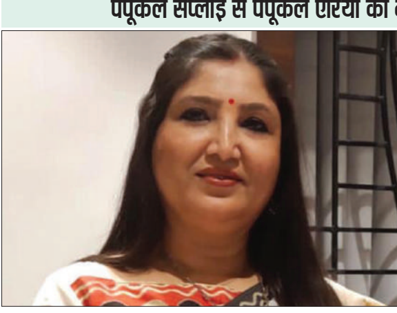
प्रभात मंत्र संवाददाता मेदिनीनगर : प्रथम महापौर ने खुशी जाहिर करते हुए कहा कि मेरे कार्यकाल का फेस 2 शहरी जलापूर्ति योजना का कार्य लगभग शुरू हो चुका है। कूड़ विवाद के चलते रुका पड़ था। जिसका समाधान सांसद ने निकाल लिया। मुझे पूरा विश्वास है कि अगले वर्ष तक कई घरों में पानी

खेलकूद स्थान भी सुरक्षित रहे। साथ ही हम हिंदुओं का पूजा स्थान को भी डिस्टर्ब ना किया जाए। प्रथम महापौर ने कहा कि मैं सांसद से यह भी अनुरोध करूंगी कि पहाड़ी एरिया जहां काफी संख्या में मुस्लिम और कुछ हिंदू भाई भी रहते हैं। साथ ही हिंदुओं का शमशान घाट भी है, उस एरिया में भी एक जलमीनार बनवाइ जाए। ताकि नदी के तट पर बसे पहाड़ी के भाइयों को शुद्ध पानी मिल सके। प्रथम महापौर ने दुख जाहिर करते हुए कहा कि पंप कल जहां से पूरे शहर को पानी सप्लाई होता है, वहीं के स्थानीय लोगों को पंप कल के पाइप लाइन से पानी नहीं मिलता। जबकि पाइपलाइन बिछ हुआ है। पहले उस पाइप लाइन में पानी सप्लाई होता था। मैं नगर आयुक्त से भी अनुरोध करूंगी कि प्राथमिकता में पंप कल एरिया में पानी सप्लाई शुरू कराई जाए।