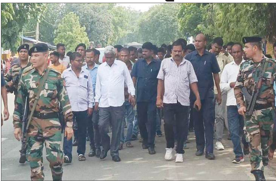
विभागों में लंबे समय से रिक पड़े पदों पर बहाली प्रक्रिया निकालकर युवाओं को नियुक्ति पत्र बांटने की तमना थी लेकिन अपने कार्यों से संतुष्ट हूँ। पूर्व मुख्यमंत्री चंपाई सोरेन ने कहा है कि पद की लालसा कभी नहीं रही है। आम जनता के बीच रहकर जनता के काम को करना है। महागठबंधन सरकार का जो भी निर्णय हुआ वह उनके लिए मान्य है। साथ ही क्षेत्र वासियों को रथयात्रा की दी शुभकामनाएं।

प्रभात मंत्र संवाददाता राजनगर : सरायकेला खरसावां जिले के राजनगर में राज्य के पूर्व मुख्यमंत्री चम्पाई सोरेन मुख्यमंत्री पद से इस्तीफा देने के बाद पहली बार अपने विधानसभा क्षेत्र के राजनगर पहुंचे। राजनगर में पत्रकारों के साथ बातचीत में कहा कि मैंने राज्य को विकास के पथ पर ले जाने का काम किया है। पांच महीने में शिक्षक बहाली, पुलिस विभाग की बहाली, जनजातीय भाषा पर आधारित शिक्षकों की बहाली, स्वास्थ्य क्षेत्र में मुख्यमंत्री अबुआ स्वास्थ्य बीमा योजना जैसे कई महत्वपूर्ण व कल्याणकारी योजनाओं की स्वीकृति देने का काम किया। अपने गृह जिला सरायकेला में लंबे समय से ग्रामीण क्षेत्र में डिग्री कॉलेज की मांग को देखते हुए दो नए डिग्री कॉलेज स्थापना की घोषणा की।पद में रहने का मालाल तो नहीं है, लेकिन शिक्षक नियुक्ति समेत कई