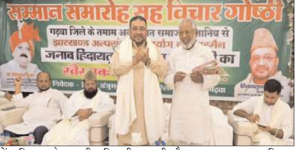
में जिला के सभी विभागीय अधिकारी उपस्थित रहे। आयोग के सदस्य डॉ.एम. तौसीफ ने कहा की सभी विभागों के अधिकारी अपनी रिपोर्ट लेकर आयोग के समक्ष पेश हुए। सभी ने बड़े ही विस्तार के साथ अपने द्वारा किए गए कार्यों को रखा। अधिकतर विभागों में बहुत अच्छा काम हुआ है। कुछ विभागों में और बेहतर काम करने की आवश्यकता है, जो की अधिकारियों को निर्देश दिया गया है। उन्होंने कहा की अल्पसंख्यक समुदाय के लोगों के लिए जो स्कीम राज्य सरकार चला

प्रभात मंत्र संवाददाता मेदिनीनगर : झारखण्ड राज्य अल्पसंख्यक आयोग के अध्यक्ष हिदायतुल्लह खान, सदस्य डॉ. एम तौसीफ एवं कारी बरकत अली पलामू परिसर में राज्य सरकार द्वारा चलाए जा रहे कल्याणकारी योजनाओं की जिला स्तरीय समीक्षा बैठक किया। सर्वप्रथम जिला के अधिकारियों ने पुष्प गुच्छ भेंट कर आयोग के अध्यक्ष एम सदस्यों का स्वागत किया। साथ ही कांग्रेस एवम जेएमएम के नेता कार्यकर्ताओं ने भी स्वागत किया। बैठक में आयोग के अध्यक्ष हिदायतुल्लह खान ने जिला के सभी विभागों में चलाई जा रही कल्याणकारी योजनाओं में अल्पसंख्यकों को उनके जनसंख्या के अनुपात में भागीदारी सुनिश्चित करने से संबंधित सभी विभागों को निर्देश दिया एवं पूर्ण रूप से अल्पसंख्यकों के लिए चलाई जा रही योजनाओं की भी समीक्षा की। बैठक