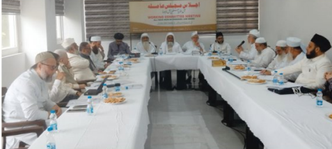
مسلم سپنل لاء بورڈ کے اجلاس میں شرعی امور پر بحث ہو رہی ہے۔