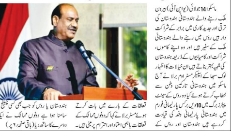
نئی دہلی، 14 جولائی (دس) ہندوستان اور روس کے مابین رفاقت برقرار رکھنے کی ضرورت ہے۔