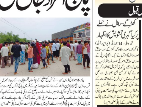
پانچ افراد جان بحق ہوئے۔