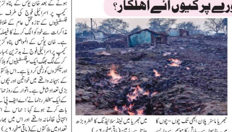
غزہ کے علاقے میں ایک مکان کو آگ لگ گئی ہے۔