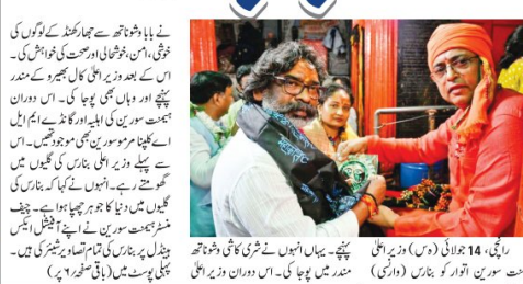
راچی، 14 جولائی (دس) وزیر اعلیٰ نے کاشی پہنچے۔ ان کے ساتھ اہلیہ کلینا مر موسورین اور دیگر اہل خانہ بھی تھے۔