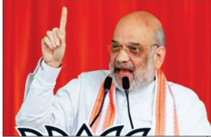
اندر، ۱۴ جولائی (این آئی)۔ اندور، ۱۴ جولائی (این آئی)۔ اندور کے مرکزی وزیر داخلہ امت شاہ نے اندور میں ماں کے نام پر پرودا لگوانے کی تقریب منعقد کی۔