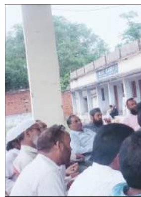
प्रभात मंत्र संवाददाता