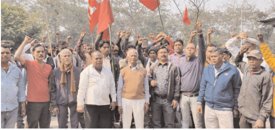
प्रदर्शन के बीच स्थानीय प्रबंधन को हड़ताल का नोटिस सौंपा। नोटिस के माध्यम से बचरा साईडिंग में 16 फरवरी से मजदूरों

प्रभात मंत्र संवाददाता पिपरवार : सीसीएल पिपरवार क्षेत्र के बचरा साईडिंग में काम करने वाले असंगठित मजदूरों ने अपनी मांगों को लेकर 16 फरवरी से बचरा साईडिंग को बंद करने की घोषणा की है। इसको लेकर साईडिंग के असंगठित मजदूरों ने यूनाइटेड कोल वर्कर्स यूनियन के नेतृत्व में एक रैली निकाल कर पिपरवार महाप्रबंधक कार्यालय के समक्ष जोरदार विरोध प्रदर्शन किया। जानकारी के अनुसार बीओसी हनुमान मंदिर मैदान में सभी मजदूर जमा हुए और जोरदार नारेबाजी के साथ रैली की शकल में जीएम ऑफिस पहुंचा, जहां विरोध