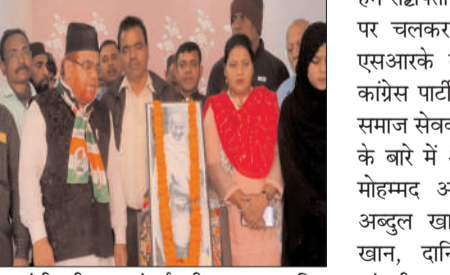
महात्मा गांधी जी का संपूर्ण जीवन एक कठिन तपस्या थी। वर्तमान परिस्थितियों में अगर हम चाहते हैं कि हम विश्व शांतिपूर्वक तरीके से विकास करता रहे तो अत्यंत आवश्यक है कि