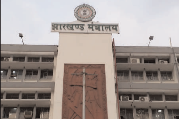
को कहा। पथ निर्माण सचिव ने टोरी रेल ओवर ब्रिज निर्माण कार्य अब