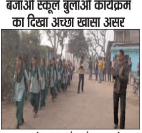
(प्रभात मंत्र संवाददाता)

गोला : झारखंड सरकार की योजना सिटी बजाओ स्कूल बुलाओ कार्यक्रम के तहत स्कूलों में बच्चों की उपस्थिति बढ़ाने की दिशा में प्रगतिशील कदम है।