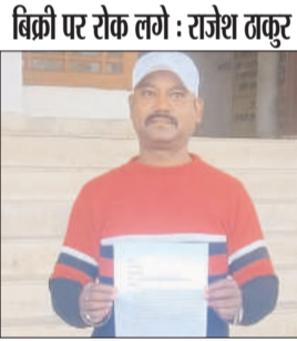
(प्रभात मंत्र संवाददाता)