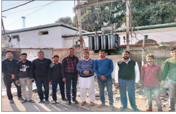
ट्रांसफार्मर लगा हुआ था। इसे देखते हुए यहां पर नया 500 केवीए का ट्रांसफार्मर लगाया गया है। इसके

गढ़वा : स्थानीय विधायक सह राज्य के पेयजल एवं स्वच्छता मंत्री मिथिलेश ठाकुर के निर्देश पर शहर में पांच सौ केवीए का ट्रांसफार्मर लगाया गया। विद्युत विभाग के विधायक प्रतिनिधि नसीम अख्तर ने इसकी जानकारी देते हुए बताया कि मंत्री श्री ठाकुर के निर्देश पर शहर के रंका मोड़ के समीप स्टेट बैंक के सामने 500 केवीए का नया ट्रांसफार्मर लगाया गया है। उन्होंने कहा कि इस क्षेत्र में गर्मी के दिनों में अधिक लोड होने के कारण परेशानी होती थी। पहले से 200 केवीए का