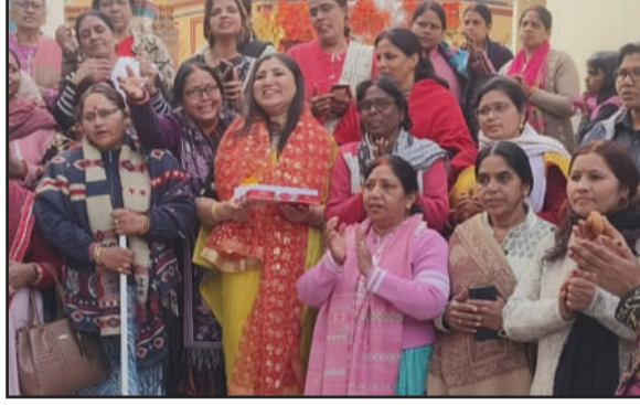
22 तारीख को श्री रामलला कनकन में विराज रहे हैं। इसलिए पूरे