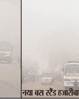
नया बस स्टैंड हजारीबाग