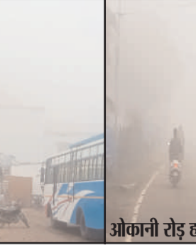
ओकानी रोड़ हजारीबाग