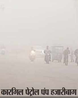
कारगिल पेट्रोल पंप हजारीबाग

प्रभात मंत्र संवाददाता हजारीबाग : राज्य सरकार की महत्वकांक्षी बिरसा सिंचाई कूप योजना के तहत लक्ष्य के विरुद्ध धोमी कार्य प्रगति पर उपायुक्त ने नाराजगी व्यक्त करते हुए संबंधित अधिकारियों को इसमें गति लाने का निर्देश दिया। इस क्रम में चूरू एवं डाडी प्रखण्ड के लक्ष्य के विरुद्ध बेहद कम प्रगति पर उपायुक्त ने कड़ी फटकार लगाकर संबंधित बीडीओ व मनोरंगा प्रोजेक्ट ऑफिसर को शोर्काज करने का निर्देश दिया। बताया गया कि राज्य सरकार की फ्लैशशिप योजनाओं को प्राथमिकता के आधार पर क्रियान्वयन करें इसमें किसी भी प्रकार की कोताही बर्दाशत नहीं की जाएगी। बैठक में आंगनबाड़ी निर्माण, डोभा, एरिया मॉनिटरिंग एम के माध्यम से संचालित योजनाओं की इंटी करने, बाब साहेब अम्बेडकर आवास योजना के लक्ष्य को समर्थन हासिल करने, रूबन मिशन योजनाओं को पूरा करने के लिए लाभकों को मोटिवेट करने, जेएसएलपीएस की योजनाओं को कन्वर्जन्स के माध्यम से पूरा करने का निर्देश उपायुक्त द्वारा संबंधित प्रखण्ड विकास पदाधिकारियों को दिया गया।