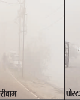
पोस्टऑफिस चौक हजारीबाग

जिससे आम जन जीवन सुचारू रूप से चलता रहे। हालांकि बोर्ड परीक्षा नजदीक होने की वजह से