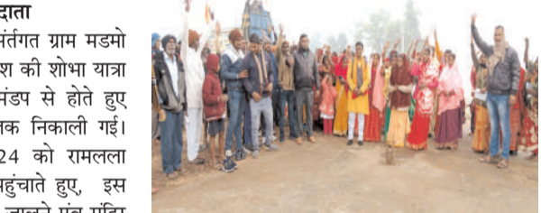
रामभक्ति में डूबा मडमों, शोभायात्रा निकालकर किया अक्षत वितरण