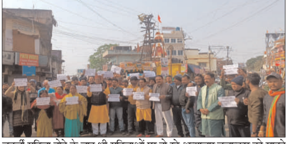
बनर्जी महिला होने के बाद भी महिलाओं पर हो रहे अत्याचार, बलात्कार को मानने को तैयार नहीं, इसी बात को लेकर हिंदूस्तान के हिंदूओं में काफी आक्रोश है जो आने वाले दिनों में व्यापक रूप लेगी। जय श्रीराम समिति के मुख्य संरक्षक व पूर्व