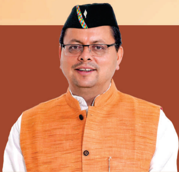
पुष्कर सिंह धामी