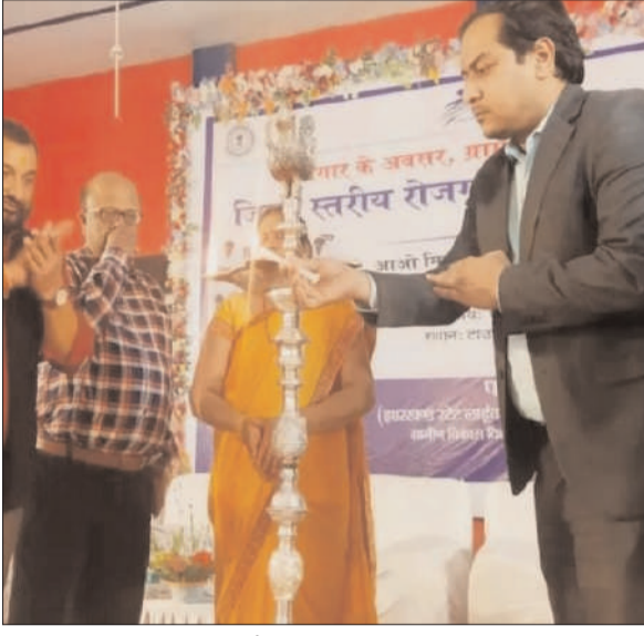
जिले में बड़ी-बड़ी कंपनियों के द्वारा जिले के युवाओं को चिन्हित कर रोजगार मुहैया कराया जा सके।

प्रभात मंत्र संवाददाता गिरिडीह : गिरिडीह जिले में मंगलवार नगर भवन, गिरिडीह में झारखंड स्टेट लाइवलीहुड प्रमोशनल सोसाइटी (JSLPS) के द्वारा जिलास्तरीय रोजगार मेला का आयोजन किया गया। कार्यक्रम का विधिवत उद्घाटन उप विकास आयुक्त व जिला परिषद अध्यक्ष, जिला कार्यक्रम प्रबंधक के द्वारा दीप प्रज्वलित कर किया गया। रोजगार मेला की शुरुआत जेएसएलपीएस के डीपीएम के द्वारा स्वागत अभिभाषण के साथ किया गया।