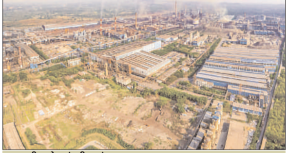
टाटा स्टील मेरामंडली प्लांट