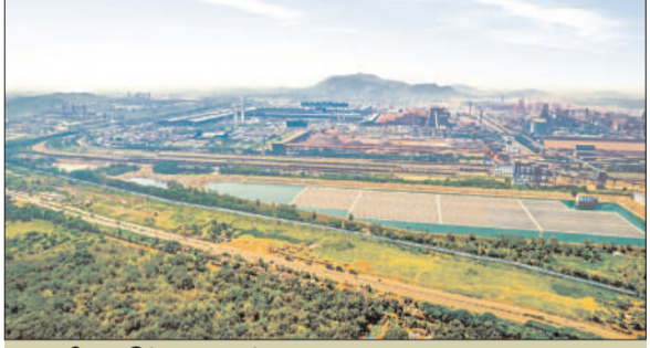
टाटा स्टील कलिंगनगर प्लांट

कंपनी का जमशेदपुर स्टील प्लांट भारत में रिस्पॉन्सिबलस्टील प्रमाणन प्राप्त करने वाला पहला प्लांट था