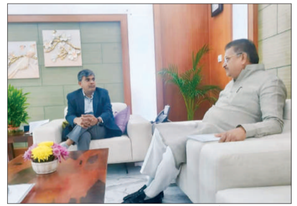
अविलंब स्थायी समाधान करने का उनसे आग्रह किया। वहीं उन्होंने यह भी बताया कि हजारीबाग लोकसभा अंतर्गत निर्माणाधीन जीटी रोड नेशनल हाईवे संख्या दो के अंतर्गत चौपारण से गोरह तक सिक्स लेन का कार्य संचालित किया जा रहा है, जिनके अंतर्गत चौपारण बरकड्ड फ्लाई ओवर का निर्माण किया जा रहा है। चौपारण का फ्लाई ओवर पिछले 12 वर्षों से निर्माणाधीन है, जिसमें अभी तक केवल पांचे का ही निर्माण हो पाया हैइसी प्रकार बरकड्ड में भी पांचे का निर्माण भी पूरी तरह से नहीं किया गया है, शेष कार्य 12 वर्षों से लंबित है। सिक्स लेन का कार्य के कारण पूरे क्षेत्र में नालियों की स्थिति बंद से बत्तर कर दी गई है, जिस वजह से जल भराव की समस्या से वहां के लोग पिछले 10 वर्षों से जूझ रहे है, इन दोनों जगह पर कार्य प्रगति पर रहने के कारण दुर्घटनाएं भी रोज देखने को मिलती रहती है। स्थानीय स्तर पर ठेकेदार या राष्ट्रीय राजमार्ग के क्षेत्रीय अधिकारियों से शिकायत भी की गई लेकिन आश्वासन के अलावा कोई प्रगति नहीं हुई, अतः इस विषय को सज्ञान में लेते हुए अविलंब कार्यवाही का उनसे आग्रह किया।