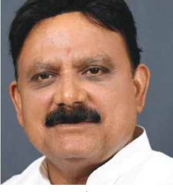
स्वावलंबन की दिशा में झारखंड सरकार का