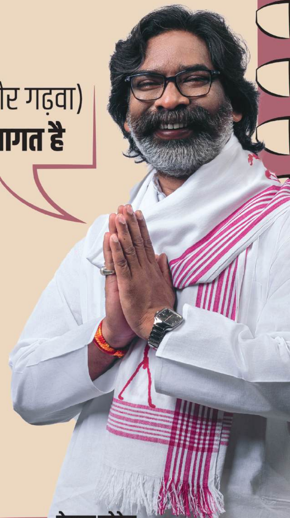
हेमन्त सोरेन मुख्यमंत्री, झारखण्ड

सितंबर से हर महीने की 15 तारीख को हर बहन के खाते में बिना देर पहुँचेगी सम्मान राशि