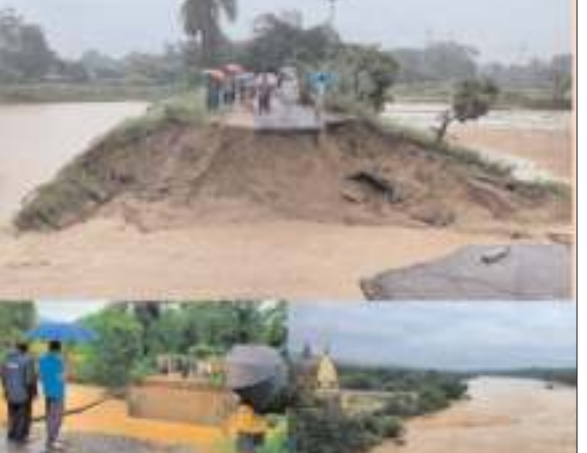
पोस्ट कालोनी के ग्रामीणों का मुख्य सड़क में पुलिया बह जाने के कारण भारी कठिनाइयों का सामना करना पड़ रहा है। बच्चे- बच्चियां विधालय

प्रभात मंत्र संवाददाता उरीमारी : बड़कागांव प्रखंड क्षेत्र के जरजा से लेकर गरसुला होकर गिदी को जोड़ने वाली मुख्य सड़क का संपर्क टूट गया है। बिने दिनों से हो रहे लगातार भारी बारिश के कारण जरजा चौक से कुछ दूरी पर तेतरिया नाला का पुलिया पानी की तेज रफतार से बह गया। जिसके चलते दर्जनों गांवों का आवागमन ठप हो गया। जिसमें मुख्य रूप से रामगढ़ पंचायत के लुंगंगा, चानो, शिखर बेड़ा, बिहड़, गरसुला, अंबा टोला, घनसलैया, पोटांग पंचायत के तेतरिया, जर जरा, पोटांग, भुरकुंडवा, न्यू बरटोला, उरीमारी हेसाबेड़ा, पिंडा, रोहनगोड़ा, पीला क्राटर एवं चेक