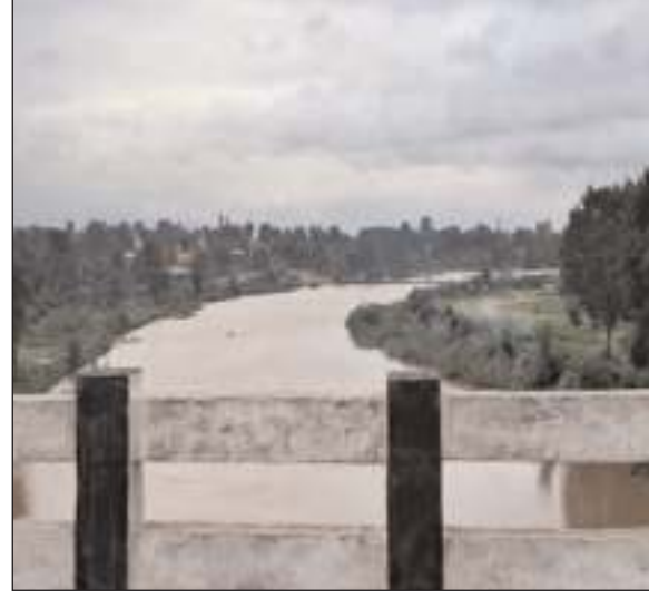
प्रभात मंत्र संवाददाता टंडवा : जंगली फुटका लेकर लौट रही तीन बच्चियां चुन्दरु नदी स्थित डमभा बागी के समीप उफनती नदी की तेज धार में बह गईं। जिससे से दो बच्चियों ने नदी के छोर पर स्थित झाड़ी को पकड़कर अपनी जान बचा ली जबकि एक बच्ची तेज धार में बह गई। इस घटना के बाद मौके पर पहुंची टंडवा थाना पुलिस की टीम एवम् एन्टीपीसी के गोताखोरो की टीम लापता बच्चों के खोजबीन का प्रयास कर रही है। खबर लिखे जाने तक लापता बच्चों का पता नहीं चल पाया है।