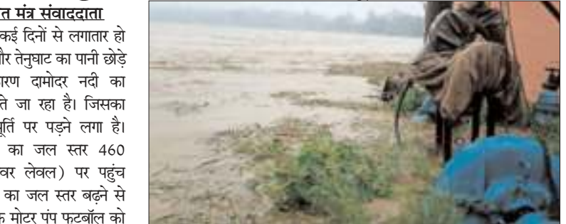
रहा है। 452 आरएल होना चाहिए। दामोदर नदी में करीब पांच फीट पानी बढ़ गया है और अभी पानी बढ़ता जा रहा है। पानी के साथ काफी मात्रा में हल्कचरा भी आ रहा है। जिसके कारण फुटबॉल जाम हो रहे हैं। जिससे रॉक्टर को जल भंडारण गृह में भेजने में दिक्कत होती है। बताते चले की जामाडोबा स्थित झामाड के जल संयंत्र से झरिया विधानसभा क्षेत्र ही नहीं पुटकी क्षेत्र के लिए भी जलापूर्ति होती है। जल स्तर बढ़ने का प्रभाव भी दोनों क्षेत्रों को भुगतना पड़ता है। करीब 12 लाख की आबादी के लिए जल भंडारण और जल सप्लाई का काम शनिवार को नहीं हो पाया। पानी का लेयर बढ़ रहा है और कचरा भी काफी मात्रा में आ रहा है। जिसके कारण जलापूर्ति बाधित रही।

प्रभात मंत्र संवाददाता झरिया : कई दिनों से लगातार हो रही बारिश और तेनुघाट का पानी छोड़े जाने के कारण दामोदर नदी का जलस्तर बढ़ते जा रहा है। जिसका असर जलापूर्ति पर पड़ने लगा है। दामोदर नदी का जल स्तर 460 आरएल (रिवर लेवल) पर पहुंच गया है। नदी का जल स्तर बढ़ने से नदी किनारे के मोटर पंप फुटबॉल को ऊपर उठा लिया गया है। वहीं शनिवार को सुबह से जामाडोबा जल संयंत्र में जल भंडारण व पानी सप्लाई का काम ठप रहा। झामाड कर्मियों का कहना है कि नदी का जल स्तर बढ़ने से फुटबॉल का लेवल सेंट करने में समय लगता है। पंप को ऊपर उठाना पड़ता है। पानी कम होने पर भी यही स्थिति उत्पन्न होती है। बावजूद जलापूर्ति करने का प्रयास किया जा