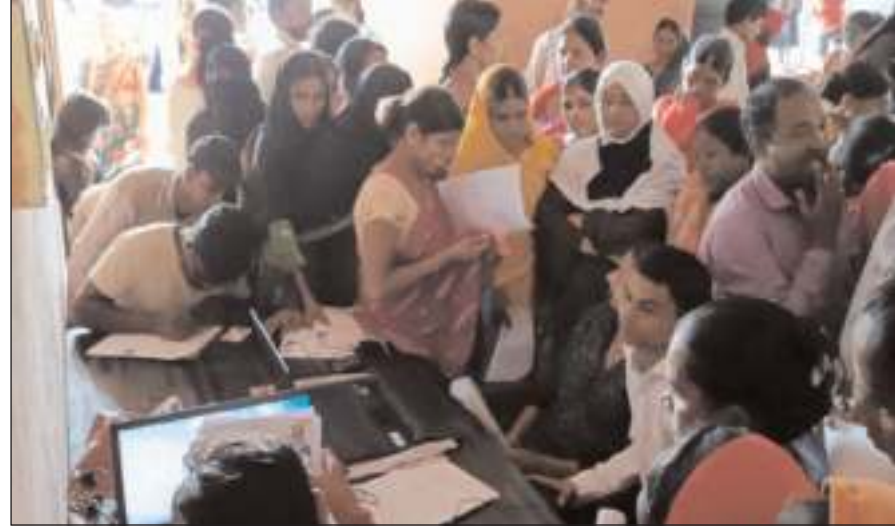
प्रभात मंत्र संवाददाता बालूमाथ : बालूमाथ प्रखंड मुख्यालय स्थित पंचायत भवन में शनिवार को कैम्प लगाकर झारखंड सरकार की मुख्यमंत्री मंडियां सम्मान योजना के लाभकों का आवेदन प्राप्त किया गया। जहां आवेदन प्राप्त करने के बाद झारखंड सरकार के वेबसाइट पर

अपलोडिंग कार्य प्रारंभ किया गया। लेकिन सर्वर डाउन होने कारण अपलोड नहीं हो पाया जिस कारण महिलाओं को परेशानी का सामना करना पड़ा। आवेदन को जमा कराने को लेकर सुबह 9:00 बजे से ही पंचायत भवन में बालूमाथ प्रखण्ड मुख्यालय विभिन्न टोले की महिलाएं पहुंची थीं। लेकिन दोपहर 2:00 बजे तक कार्य नहीं होने के कारण वे परेशान दिखीं। मिली जानकारी के अनुसार 10 अगस्त तक आवेदनों को अपलोड किया जाएगा। वहीं आवेदन का अपलोड का कार्य कर रहे कंप्यूटर ऑपरेटर ने बताया कि सर्वर डाउन होने की वजह से सुबह से ही आवेदन को अपलोड नहीं कर पा रहा है। सर्वर ठीक हो जाने के बाद इसी आवेदन को अपलोड कर दिया जाएगा।