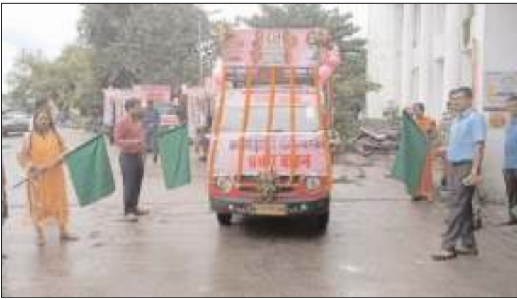
खाना किया जागरूकता वाहन के द्वारा जिले के मधुरती क्षेत्र में जाकर ग्रामीणों को झारखंड मुख्यमंत्री महिला सम्मान योजना के लाभ के प्रति जागरूक किया जाएगा वहीं उन्हें 3 अगस्त से 10

अगस्त तक पंचायत भवन में झारखंड मुख्यमंत्री मईयां सम्मान योजना के तहत आवेदन पत्रों के निबंधन हेतु चलने वाले शिविर के प्रति भी जागरूक किया जाएगा। इस अवसर पर जिला