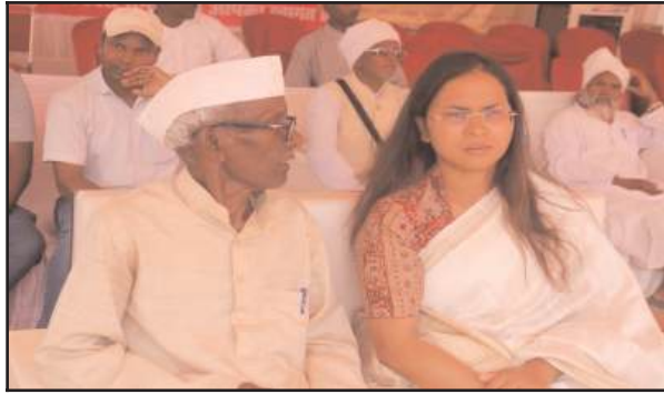
बलिदान और किसी भी प्रकार का अभिमान न होना ही टाना भगतों की