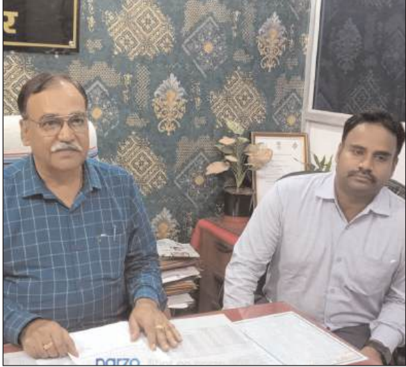
खुराकें देंगे। जिले में 1030 दलों, 130 पर्यवेक्षक, और 32 द्रांजिट दल बनाए गए हैं। इन दलों के सहयोग से 156,000 बच्चों को पल्स पोलियो की खुराकें दी जाएगी। कार्यक्रम की

प्रभात मंत्र संवाददाता लातेहार : सदर अस्पताल के सिविल सर्जन कार्यालय में शनिवार को प्रेस वार्ता का आयोजन किया गया। इस दौरान सिविल सर्जन डॉ. अवधेश सिंह ने आगामी राष्ट्रीय पल्स पोलियो अभियान, अगस्त 2024 की तैयारियों की जानकारी दी। उन्होंने बताया कि 25 अगस्त 2024 से 27 अगस्त 2024 तक चलने वाले इस अभियान के लिए सभी तैयारियां पूरी कर ली गई हैं। डॉ. सिंह ने बताया कि 25 अगस्त को जिले के 997 बूथों पर 0 से 5 साल के बच्चों को पल्स पोलियो की खुराकें दी जाएगी। जिन्होंने 25 अगस्त को नहीं पीने सके उन्हें 26 और 27 अगस्त को स्वास्थ्य कर्मों घर-घर जाकर उन बच्चों को पल्स पोलियो की