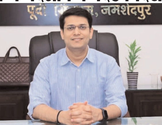
इस अवधि में प्रार्थना सभा या मध्याह्न भोजन का संचालन जारी रहेगा। यह आदेश 22 अप्रैल से अगले आदेश तक लागू रहेगा।