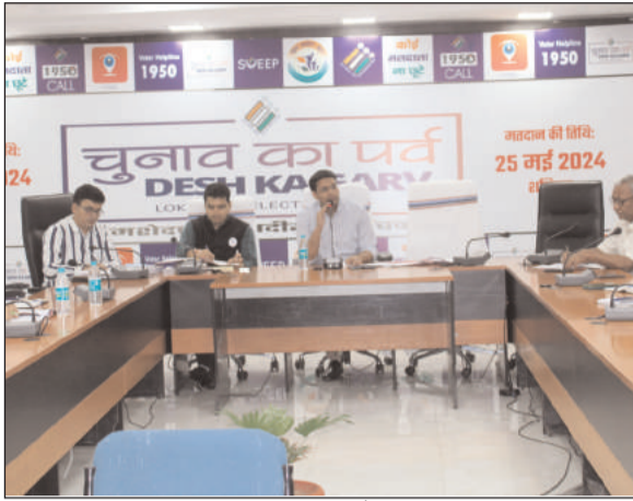
निर्देश दिया गया। इसके अलावे अप्रैल तक अभियान चलाकर छूटे सभी कंपनी परिसर में 22 से 24 हुए कर्मियों के नाम निबंधन कराने