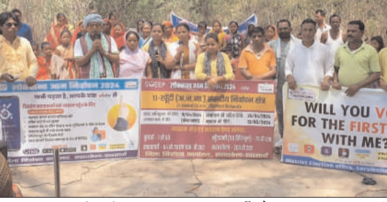
प्रभात मंत्र संवाददाता तिरुलडीह : आगामी लोकसभा चुनाव के मद्देनजर सरायकेला जिले के विभिन्न इलाकों में मतदाता जागरूकता कार्यक्रम का आयोजन किया जा रहा है। इसी क्रम में आज नुकड़ नाटक के माध्यम से पथ कम्युनिकेशन की ओर से नीमडीह प्रखंड के झिमी पंचायत में एवं आदरडीह पंचायत में लोक कला मंच के द्वारा कुंकड़ प्रखंड के रोलाहातु एवं तरम्बा में एवं