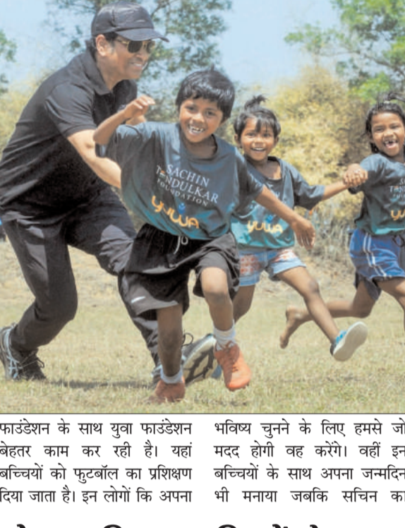
फाउंडेशन के साथ युवा फाउंडेशन बेहतर काम कर रही है। यहां बच्चियों को फुटबॉल का प्रशिक्षण दिया जाता है। इन लोगों कि अपना भविष्य चुनने के लिए हमसे जो मदद होगी वह करेंगे। वहीं इन बच्चियों के साथ अपना जन्मदिन भी मनाया जबकि सचिन का

दे दिन पहले मनाया जन्मदिन सचिन तेंदुलकर ने कार्यक्रम के बाद सचिन ने पत्रकारों से बात करते हुए कहा कि वे हमारे लिए यादगार दिन रहा। मेरे साथ मेरी पत्नी अंजली के अलावा हमारी पूरी टीम थी। सभी लोग युवा फाउंडेशन की टीम के साथ समय बीताने आए थे। उन्होंने अपने फाउंडेशन के बारे में जानकारी देते हुए आगे कहा कि हमारा फाउंडेशन तीन क्षेत्रों में शिक्षा, खेल और स्वास्थ्य पर काम करता है। इसी से हम अपने देश के भविष्य को आकार दे सकते हैं। उन्होंने बताया कि सचिन तेंदुलकर