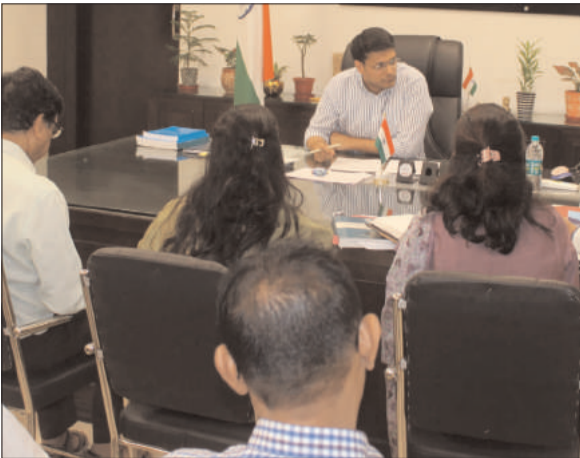
100 मीटर के दायरे में बेरिफेडिंग, आदर्श आचार संहिता का अक्षरशः नामांकन प्रक्रिया की वीडियोग्राफी, अनुपालन आदि बिंदुओं पर विस्तार