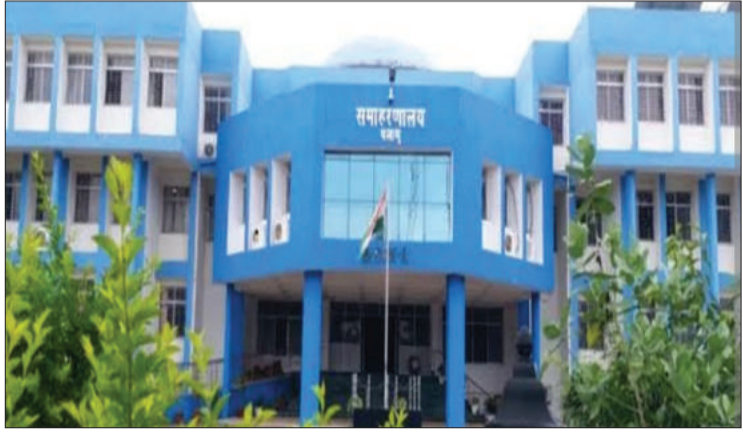
में उम्मीदवार सहित पांच व्यक्ति अंदर जा सकते हैं। नामांकन प्रक्रिया 25 अप्रैल तक