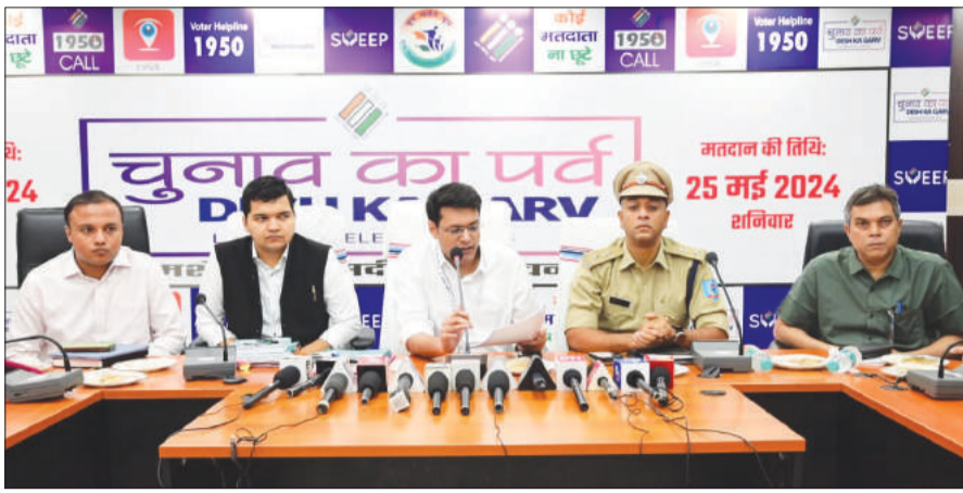
किए गए हैं।

कुछ अहम जानकारीयां - चुनाव आयोग द्वारा 2 वय्य प्रेक्षक, 01 सामान्य प्रेक्षक व 01 पुलिस प्रेक्षक जिले के लिए नामित