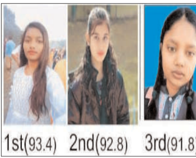
1st(93.4) 2nd(92.8) 3rd(91.8)