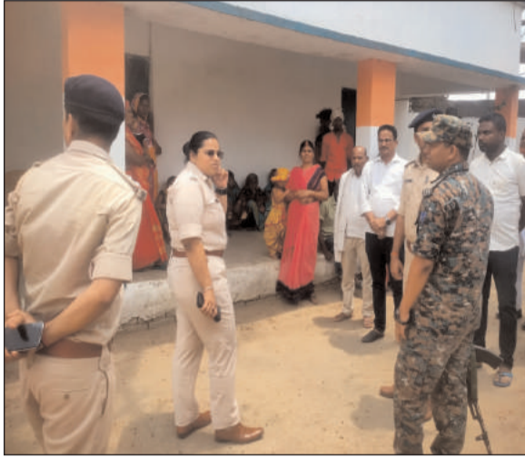
पुलिस पदाधिकारी और थाना प्रभारी को निर्देश दिया है सभी मतदान केंद्र पर शांति व्यवस्था बनाये रखने हेतु निर्देशित की है। मौके पर छतरपुर अनुमंडल पुलिस

प्रभात मंत्र संवाददाता नौडीहा बाजार : आगामी लोकसभा 2024 के आम चुनाव को लेकर पलामू पुलिस अधीक्षक रिष्मा रमेशन ने छतरपुर - पाटन विधानसभा क्षेत्र के कई मतदान केंद्रों की भौतिक सत्यापन की। नौडीहा बाजार थाना के मतदान केंद्र झरहा, बलरा के अलावा छतरपुर के भी मतदान केंद्रों पर पहुंच कर आगामी 13 मई को बिना डर भय के साथ अपना मतदान करने की अपील मतदाताओं से की है। उन्होंने बीएलओ व जल सहीया, विधालय के प्रबंधन समिति के अध्यक्ष से मिल कर मतदाताओं के जागरूक करने की बात कही। उन्होंने कहा कि किसी प्रकार की डरने की कोई जरूरत नहीं है और निर्भीक होकर अपना अपना मतदान केंद्रों पर एक एक कीर्ती वोट अवश्य करें। साथी ही सभी उन्होंने अनुमंडल