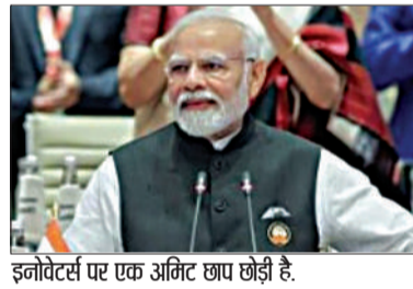
इन्दोवेटर्स पर एक अंजित छाप छोड़ी है।

पीएम ने कहा कि डॉ. एमएस स्वामीनाथन जी के निधन से गहरा दुख हुआ। हमारे देश के इतिहास में एक बहुत बड़े व्यक्ति हैं, कृषि में उनके अमूल्यपूर्ण कार्य ने लाखों लोगों के जीवन को बदल दिया और हमारे देश के लिए खाद्य सुरक्षा सुनिश्चित की। कृषि में अपने क्रांतिकारी योगदान के अलावा, डॉ. स्वामीनाथन नवाचार के पावरहाउस और कई लोगों के लिए एक मॉडल थे। अनुसंधान और नौकराई के प्रति उनकी अटूट प्रतिबद्धता ने अनगिनत वैज्ञानिकों और उल्लेखनीय योगदान के लिए भारत सरकार ने उन्हें पद्म भूषण से नवाजा था।