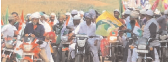
नरोली पंचगाई अम्बवा नगजुआ चरीमा आदि समेत अन्य गांवों से अहले सुबह 7:00 बजे से जुलूस ए मोहम्मदी काफी शांतिपूर्ण एवं धूमधाम के साथ निकालकर गली कूची में हर्षोल्लास के साथ जुलूस निकाला गया एवं ईद मिलादुन्नबी त्योहार की मुबारकबाद दी गई। इस दौरान जशने-ईद मिलादुन्नबी के मौके पर सुरक्षा व्यवस्था की कमान संभाली गई थी में थाना क्षेत्र में बारह रबिउल अव्वल त्यौहार को शांतिपूर्ण तरीके से संपन्न कराने