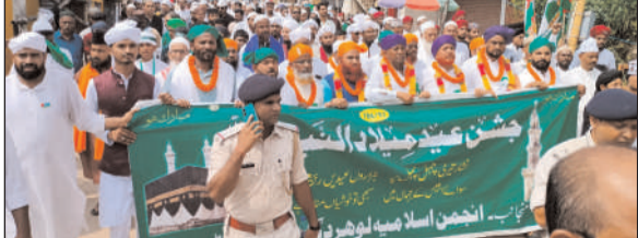
मठ,न्यू रोड, महात्मा गांधी पथ, गुदरी बाजार, शास्त्री चौक, तेतर तर, थाना रोड समेत विभिन्न मार्गों से गुजरते हुए पुनः जामा मस्जिद के पास पहुंचे। जहां दुरूद व सलाम के बाद जिला समेत देश में शांति, सौहार्द एवं समृद्धि के लिए दुआओं के साथ जुलूस का समापन हुआ। इस दौरान असरलातो वससलामो अलैका या रसूल अल्लाह जैसे नारों से पूरा शहर गुंजायमान होता रहा। विभिन्न चौक-चौहों पर जुलूस का स्वागत भी किया गया। जुलूस में

प्रभात मंत्र संवाददाता लोहरदगा : पैगम्बर-ए-जहां हजरत मोहम्मद साहब (स०अ०) के जन्म दिवस के मुबारक मौके पर गुरुवार को शांति एवं सौहार्द के साथ इस्लाम धर्मावलंबियों ने जशने-ईद मिलादुन्नबी के रूप में मनाया। इस मौके पर अंजुमन इस्लामिया के तत्वाधान में जुलूस-ए-मोहम्मदी भी निकाली गयी। जिसका नेतृत्व मसाजिदों के आइमा-ए-कराम और अंजुमन इस्लामिया कमिटी के ओहदेदारान व विभिन्न पंचायतों के सदर व सेक्रेटरी कर रहे थे। हरे रंगों के परचम और खूबसूरत रंग-बिरंगे पताके हाथों में लिये जनसैलोक के रूप में मुस्लिम समुदाय स्थानीय जामा मस्जिद के समीप से होते हुए बड़ा तालाब, बाजू रोड, तैगी नगर, अमला टोली, सोमवार बाजार, पावरगंज, बाबा