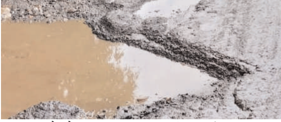
वाहन चालकों को इसका अंदाजा नहीं लगा पाते हैं जिससे सड़क पर वाहन फंसने की स्थिति पैदा हो जाती है। आए दिन वाहनों के फंसने से गाड़ियों की लम्बी कतार लग जाती है। साथ ही कभी भी

प्रभात मंत्र संवाददाता गोला : रामगढ़ जिले के गोला थाना क्षेत्र से मुरी सिल्ली पथ को जोड़ने वाली मार्ग पुरी तरह से जर्जर हो गई है। बारिश के इस मौसम में रुक रुक कर हो रही लगातार बारिश से सड़क का हाल बेहाल हो चुका हैं। इसी सड़क से प्रतिदिन सैकड़ों वाहन का आवागमन होता हैं।जबकि डीभीसी चौक से मुरी पथ पर बनी पुल की स्थिति भी धीरे धीरे जर्जर होते जा रही है। इस पुल की सड़क पर जगह जगह गढ़े हो गए हैं जिससे सड़क पर पानी भर जाती है और