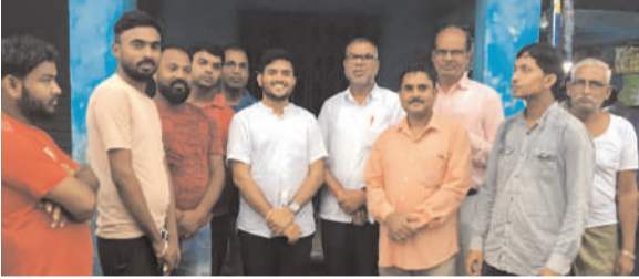
सभा में होगा।सभा में मुख्य तौर पर बरही विधानसभा क्षेत्र के लोग सम्मिलित होंगे। इस सभा में लगभग 50 हजार लोग सम्मिलित होंगे।सभा के सफल आयोजन को लेकर चौपारण के बसरिया, चतरा मोड़, इटखोरी, मयूरहंड, वृंदावन, सरैया, पदमा आदि क्षेत्रों में जनसंपर्क