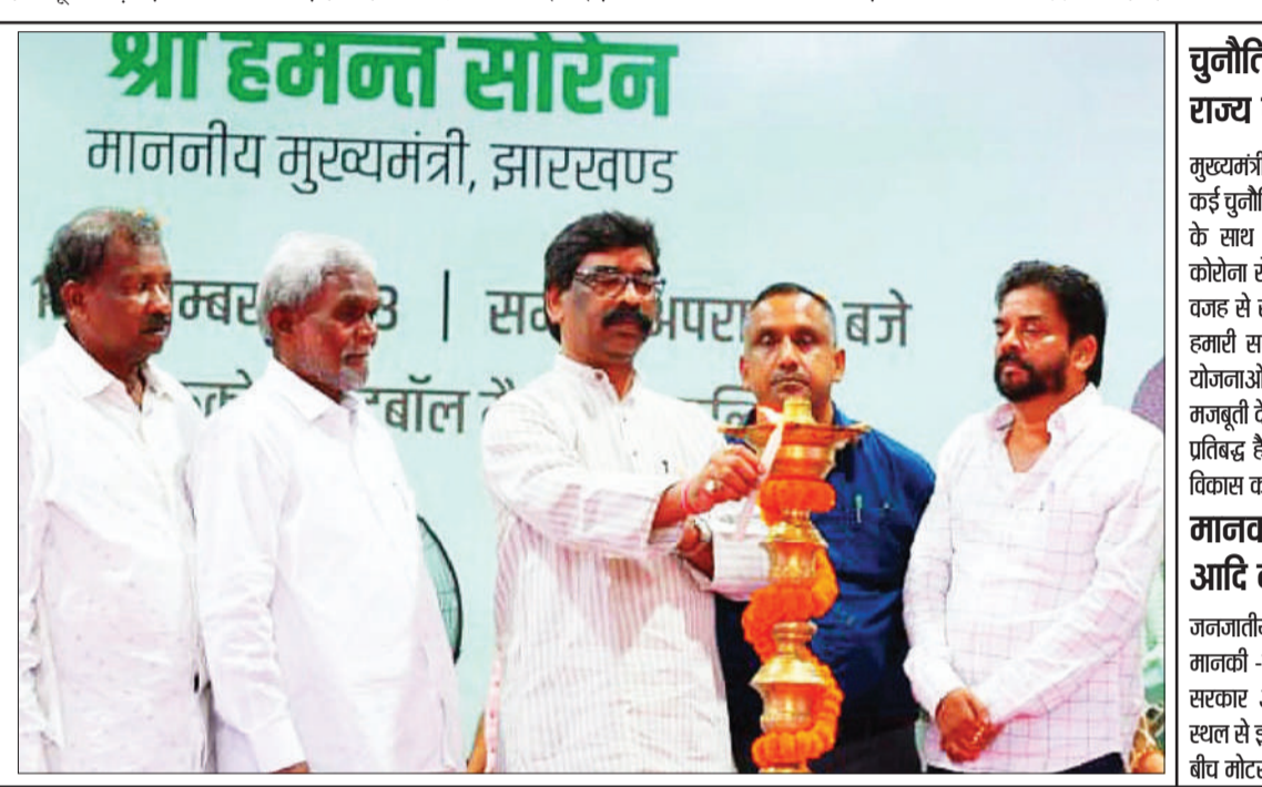
श्री हेमन्त सोरेन माननीय मुख्यमंत्री, झारखण्ड

मुख्यमंत्री ने कहा कि राज्य में शिक्षा की बेहतरी के लिए सरकार लगातार काम कर रही है। बच्चों को उच्च और गुणवत्तायुक्त शिक्षा मिले, इसके लिए विद्यालयों में सुविधा और इंफ्रास्ट्रक्चर मजबूत किया जा रहा है। स्कूल ऑफ एक्सीलेंस खोले गए हैं। यहां के शिक्षकों को आईआईएम अहमदाबाद में प्रशिक्षण दिलाया गया है ताकि वे आधुनिक तरीके से बच्चों को पढ़ सकें। इतना ही नहीं, बच्चों की स्कूली शिक्षा से लेकर उच्च शिक्षा तक और प्रतियोगिता परीक्षाओं की तैयारी से लेकर विभिन्न कोर्सेज को करने के लिए सरकार आर्थिक मदद कर रही है।