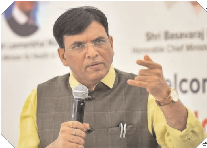
डॉ. मनसुख मांडविया (डॉ. मनसुख मांडविया केंद्रीय स्वास्थ्य व परिवार कल्याण एवं रसायन व उर्वरक मंत्री हैं।)