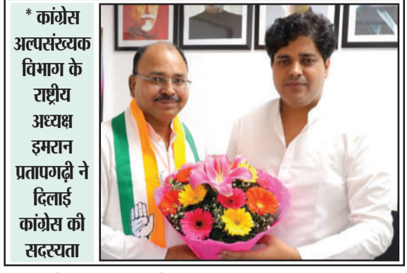
* कांग्रेस अल्पसंख्यक विभाग के राष्ट्रीय अध्यक्ष इमरान प्रतापगढ़ी ने दिलाई कांग्रेस की सदस्यता