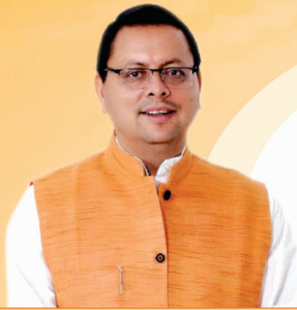
पुष्कर सिंह धामी मुख्यमंत्री, उत्तराखण्ड