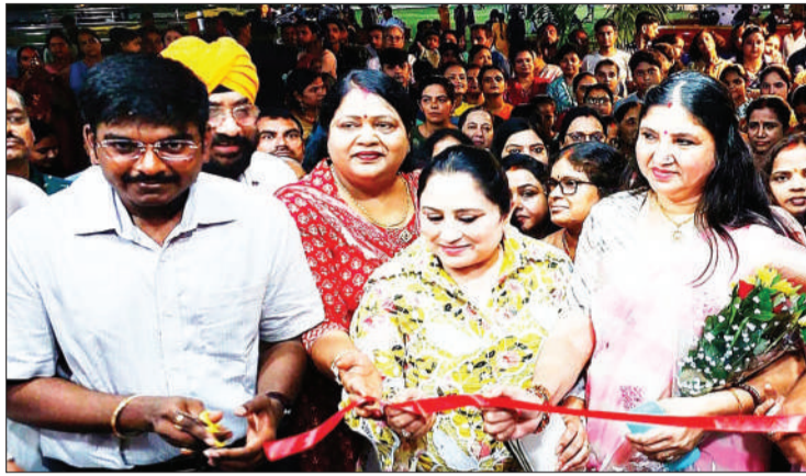
हमारा शहर बदल रहा है। गांधी मैदान जहां कचरे का ढेर लगा रहता था। अगल-बगल के घर वाले खिड़कियां बंद रखते थे। ताकि दुर्गंध ना आए वही आज उद्यान के तरफ की खिड़कियां खोली जा रही है। लोग स्वस्थ क्रिया एवं योग क्रिया कर रहे बड़े, बुजुर्ग, माताएं, बहने

प्रभात मंत्र संवाददाता मेदिनीनगर : गांधी उद्यान में जैरी लैंड का उद्घाटन नगर आयुक्त रवि आनंद एवं प्रथम महापौर अरुणा शंकर द्वारा रविवार की शाम किया गया। इस अवसर पर काफी संख्या में शहर के गण्यमान्य महिला पुरुष उपस्थित थे व नगर आयुक्त श्री रवि आनंद ने उद्घाटन करते हुए कहा यह गेम जेन बच्चों को अपनी ओर आकर्षित करेगा। लेकिन गरीब बच्चों के लिए सप्ताह में एक दिन 3 घंटे का अवसर निशुल्क दें। ताकि वे बच्चे भी इस नए-नए गेम्स का लुप्त उद्य संके। उन्होंने कहा निगम ने कई और भी योजनाएं बना रखी हैं, जो निगम क्षेत्र के तस्वीर को बदलेगा। प्रथम महापौर ने कहा