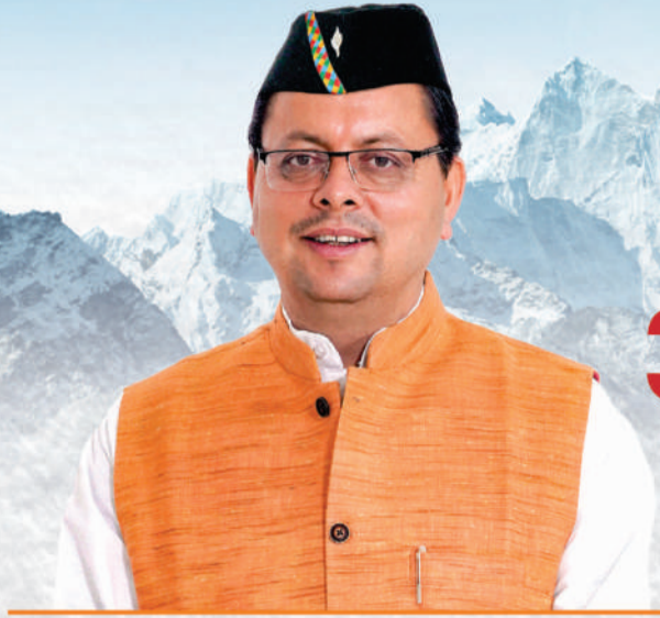
पुष्कर सिंह धामी मुख्यमंत्री, उत्तराखण्ड