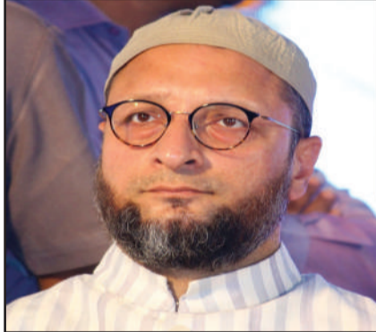
सता में लौटेंगे। राजस्थान में रण में ओवैसी तेलंगाना में मुख्यमंत्री केसीआर की भारत राष्ट्र समिति (बीआरएस) और ओवैसी की एआईएमआईएम के बीच गठबंधन है। यहां पर बीआरएस-एआईएमआईएम की जोड़ी का मुकाबला कांग्रेस और बीजेपी के साथ होने वाला है। वहीं, ओवैसी ने राजस्थान चुनाव में भी किस्मत आजमाने का फैसला किया है। ओवैसी की नजर राजस्थान की मुस्लिम वोटर्स वाली सीटों पर है। उन्होंने इस बात का पहले ही इशारा किया था कि वह 30 से 40 उम्मीदवार राजस्थान में उतारने वाले हैं।

नई दिल्ली : चुनाव की तारीखों का ऐलान होने के साथ ही हैदराबाद सांसद और एआईएमआईएम चीफ असदुद्दीन ओवैसी ने चुनावी जीत की हुंकार भरी है। उन्होंने कहा है कि उनकी पार्टी चुनाव के लिए तैयार है। ओवैसी ने कहा कि राजस्थान में 23 नवंबर को चुनाव होने हैं। हमने राजस्थान में 3 उम्मीदवारों का ऐलान कर दिया है और हम जल्द ही तेलंगाना में भी ऐसा ही करने वाले हैं। हमारी पार्टी चुनाव के लिए तैयार है। उन्होंने कहा कि मुझे उम्मीद है कि तेलंगाना के लोग हमारे प्रत्याशियों का समर्थन करेंगे। हम यह सुनिश्चित करेंगे कि चुनाव की भावना के अनुरूप शांतिपूर्ण चुनाव करवा जाएं। हम स्वतंत्र और निष्पक्ष चुनाव चाहते हैं। इस बार एआईएमआईएम राजस्थान के रण में भी कूद गई है। हमें उम्मीद है केसीआर फिर बनेंगे सीएम : ओवैसी एआईएमआईएम चीफ ने कहा कि लोगों को आरसएसएस और बीजेपी से सावधान रहने की जरूरत है। हम इस बार चुनाव में अल्पसंख्यकों और दलितों को राजनीतिक नेतृत्व देने का मुद्दा उठाएंगे। उन्होंने कहा कि हमारी पार्टी के लोग चुनाव के लिए लगे हुए हैं। जिस विधानसभा सीट से हमारे प्रत्याशी चुनाव लड़ेंगे, वहां से उन्हें जीत मिलेगी। उन्होंने कहा कि हमें उम्मीद है कि मुख्यमंत्री केसीआर एक बार फिर से तेलंगाना के सीएम के रूप में