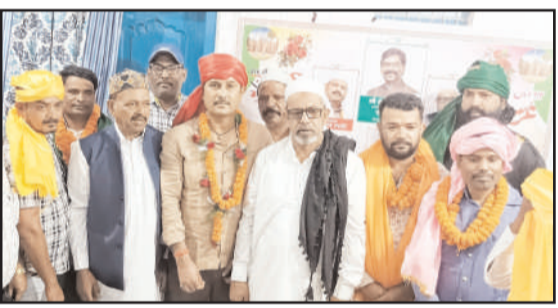
रांची (प्रभात मंत्र संवाददाता) : आजसू पार्टी के केंद्रीय अध्यक्ष सुदेश महतो ने सोमवार को उर्स के मौके पर डेरंडा स्थित हजरत कुतुबुद्दीन रिसालदार शाह बाबा की मजार पर चादरपोशी की।

रांची (प्रभात मंत्र संवाददाता) : आजसू पार्टी के केंद्रीय अध्यक्ष सुदेश महतो ने सोमवार को उर्स के मौके पर डेरंडा स्थित हजरत कुतुबुद्दीन रिसालदार शाह बाबा की मजार पर चादरपोशी की। इस दौरान उन्होंने राज्य में अमान चैन की दुआ मांगी। साथ ही मजार के विकास में कमेटी को हरदमद मदद देने की बात कही। मौके पर मजार कमेटी के सदस्यों ने आजसू सुप्रीमो और उनके साथ आर्यी पूरी टीम का मजार परिसर में फूलों की माला और पगड़ी बांध कर स्वागत किया।